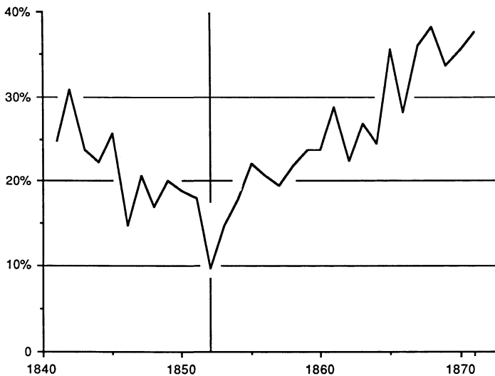
Graphique 2. Proportion (%) d'enfants abandonnés à la Crèche d'Youville, nés ou baptisés à l'extérieur de la ville de Montréal. 1841-1871.

Source : Archives des Soeurs Grises de Montréal, "Registres des enfants trouvés", 1841-1871.