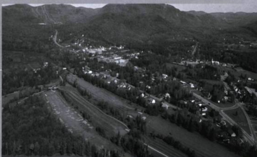
Vue de la vallée de la rivière Hibou et du hameau de Stoneham, à droite.

Les notes qui suivent, tirées des textes de M. Godin, présentent les faits saillants de la création des Cantons-Unis de Stoneham-et-Tewkesbury.