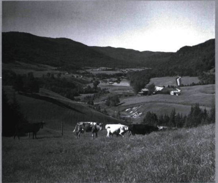
Vue de la vallée de Tewkesbury.

Le 13 mars 1801, Chandler signait un bail à ferme en faveur d'Étienne Gagné de Lorette pour la ferme et les terres du défunt Toosey. Le bailleur et le fermier partageront à parts égales les récoltes et les frais. Le fermier s'engageait à amener avec lui une vache, une taure, une jument, une pouliche d'un an et un porc. De son côté, le bailleur promettait de lui donner deux vaches à lait et un mouton, en plus des quatre moutons déjà à la ferme. Le bailleur s'engageait à effectuer les réparations nécessaires à la maison et le fermier allait devoir