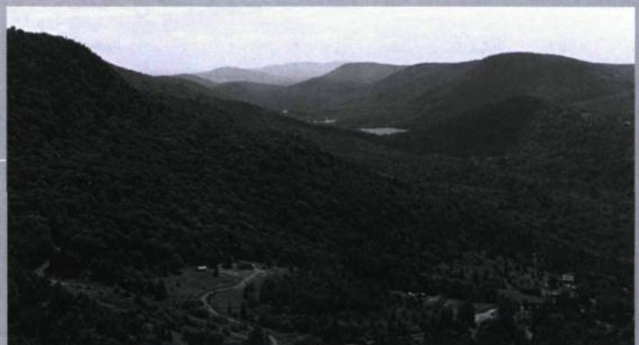
Vue de la vallée de la Jacques-Cartier à Tewkesbury, vers le nord. (Source : Société d'histoire de Stoneham-Tewkesbury, fonds Guy Godin, photographie de Guy Godin)

(Source : Société d'histoire de Stoneham-Tewkesbury, fonds Guy Godin, photographie de Guy Godin)