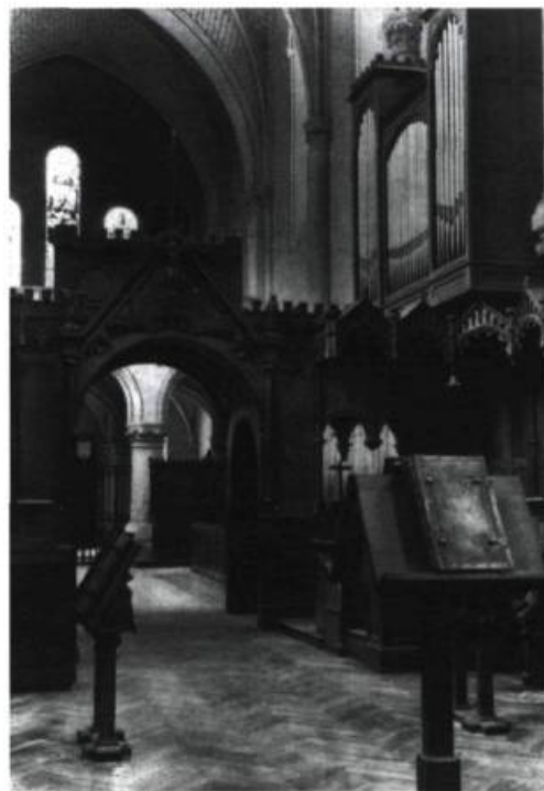
Vue intérieure de l'église abbatiale de Bellefontaine

Peu à peu, sous l'impulsion d'un supérieur de grand talent, Dom Michel Le Port, la restauration se poursuivit lentement et dans une grande pauvreté. Dom Michel fut d'abord élu prieur claustral, Dom Augustin de Lestrangle étant alors supérieur jusqu'à sa