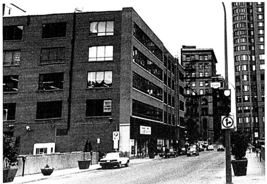
Le nouvel édifice Burland-Desbarats , coin Bleury et Craig (St-Antoine). L'Opinion Publique , 1 er juillet 1875 et le site tel qu'il apparaît aujourd'hui.