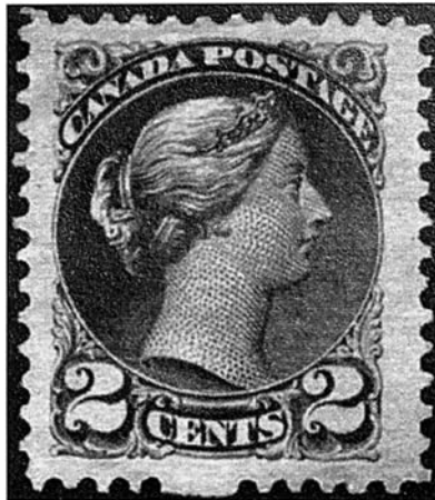
Timbre de l'émission «Petites Reines»

Les premières émissions qu'elle réalisa furent les figures de la reine Victoria que l'on connaît aujourd'hui sous les noms de «Grandes Reines» et «Petites Reines» et qui virent respectivement le jour le 1 er avril 1868 (1/2 cent à 15 cents) et en 1870. Le design original des «Grosses Reines» (1868) fut transformé en un format