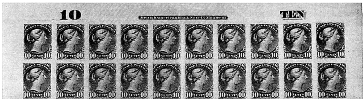
Le 10c «Petites Reines», la première émission de timbres canadiens imprimée à Montréal par la BABN en 1874. À noter la mention «Montréal» dans la signature de l'imprimeur, sans la marge.

Toutefois, ce mariage plus ou moins «forcé» allait engendrer des difficultés pour l'avenir... En 1881, après bien des confrontations avec Burland, Smillie démissionnait pour fonder quelques an-