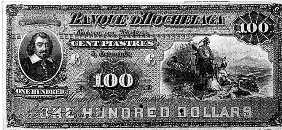
Billet de banque de la Banque d'Hochelaga imprimé par la BABN à Montréal.

Il y avait 37 banques privées au Canada lors de la Confédération. Lors des 62 années suivantes, 37 nouvelles banques furent créées, 29 firent faillite et 35 banques fermèrent ou furent absorbées par la concurrence. En 1935, il n'en restait que 10. Ces banques émettaient toutes leurs propres billets de banque jusqu'à la constitution de la Banque du Canada qui désormais se chargerait de l'émission des billets de banques canadiens. La BABN au cours des années a conçu et réalisé des billets de banque pour pas moins de 67 différentes banques canadiennes et pour d'autres pays en plus d'imprimer des actions de bourse et différentes formes de valeurs fiduciaires. La plupart des billets gravés étaient imprimés en deux couleurs (habituellement le vert «Matthew's Patent Green Tint» et le noir) mais certaines banques y ajoutèrent des couleurs qui font de ces billets de véritables œuvres d'art. Les billets de La Banque d'Hochelaga (jaune, bleu, orange et rouge) en sont un exemple.