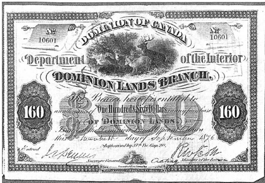
Certificat de valeurs imprimé à Montréal par la British American Bank Note. (Archives nationales).

Lovell Directory (éditions de 1862 à 1895) sur microfiches, Winthrop S. Boggs, The postage Stamps and Postal History of Canada , Quaterman Publications inc, 1974 - réédition), L'Opinion Publique (hebdomadaire), Le Canadian Illustrated (hebdomadaire), Ninety Years of Security Printing (British American Bank Note Company Limited), British American Bank Note Company Limited, 1956, Papers in Reference to Bank Note Contract , Ot-