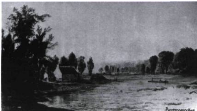
Ce dessin ancien signé Duncanson Pinx semble représenter le moulin du Gros-Sault et la décharge de son canal, alors qu'un radeau défie les eaux tumultueuses.

en eau calme, en aval de l'île de la Visitation, les hommes retournaient à l'Abord-à-Plouffe en voiture prendre charge de d'autres radeaux. Sur leur passage, rap-