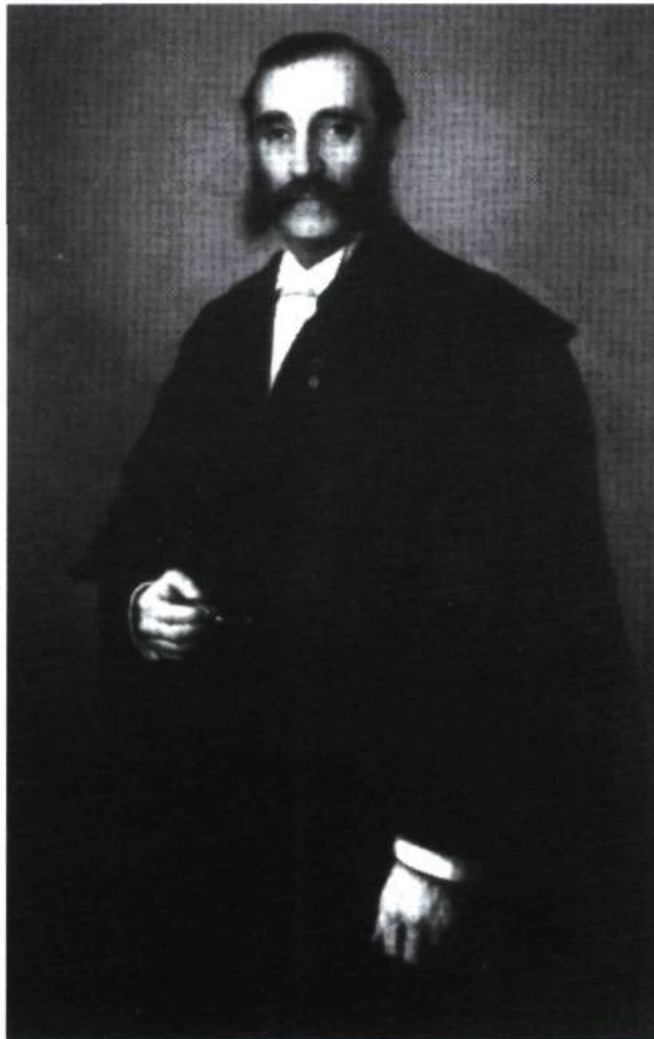
Félix-Gabriel Marchand (1832-1900)

La tenue de ce colloque me permet de souligner que l'année 1997 coïncide avec le centenaire de l'accession de Félix-Gabriel Marchand au poste de premier ministre du Québec le 24 mai 1897.