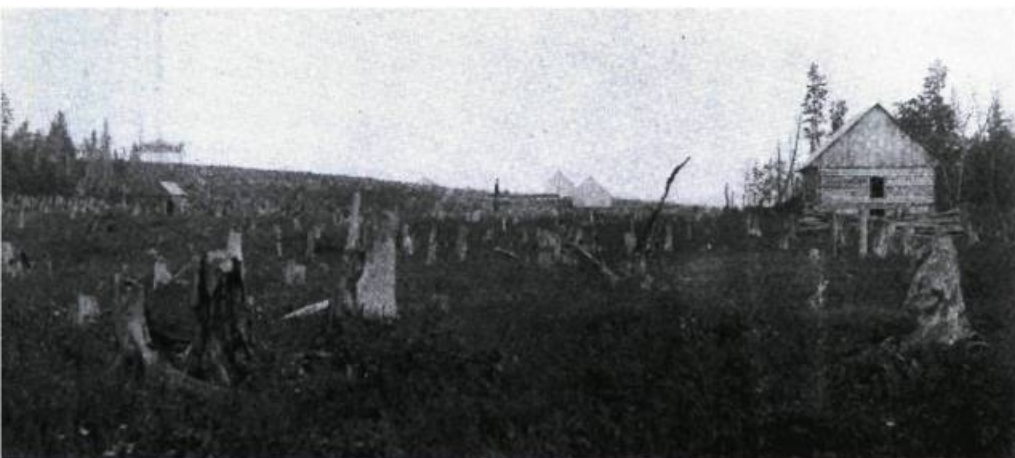
La colonie de Sainte-Apolline-de-Patton avant 1900.

Cette paroisse, détachée de Saint-Pamphile, fut connue de 1911 à 1956 comme la municipalité des Cantons unis de Casgrain-et-Leverrier. Elle devint Saint-Adalbert en