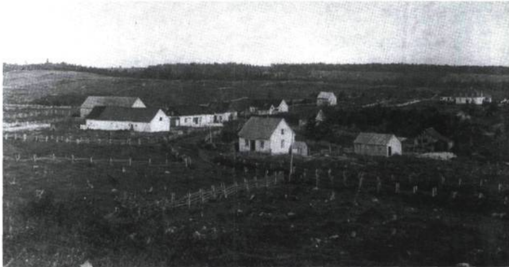
Vue de Saint-Damase sur la route Elgin avant 1900.

Pour relier le comté de Dorchester à Gaspé,