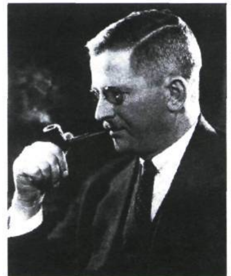
Georges Bouchard, agronome, professeur et écrivain, il occupe le siège de Kamouraska à la Chambre des Communes de 1925 à 1940.

Si impressionnant que soit le clocher par son aspect, il remue encore plus profondément l'âme quand il s'anime et met en branle sa sonnerie de bronze. La cloche, c'est la voix qui parle des cieux à la terre; elle annonce ou célèbre dans une variété de rythmes que chacun connaît, les événements religieux et civils de la vie rurale. Et l'habitant sait qu'elle ne trompe point; il l'aime comme il aime sa glèbe et son ciel. N'est-elle pas pour lui l'écho de la terre et le cantique du paradis?