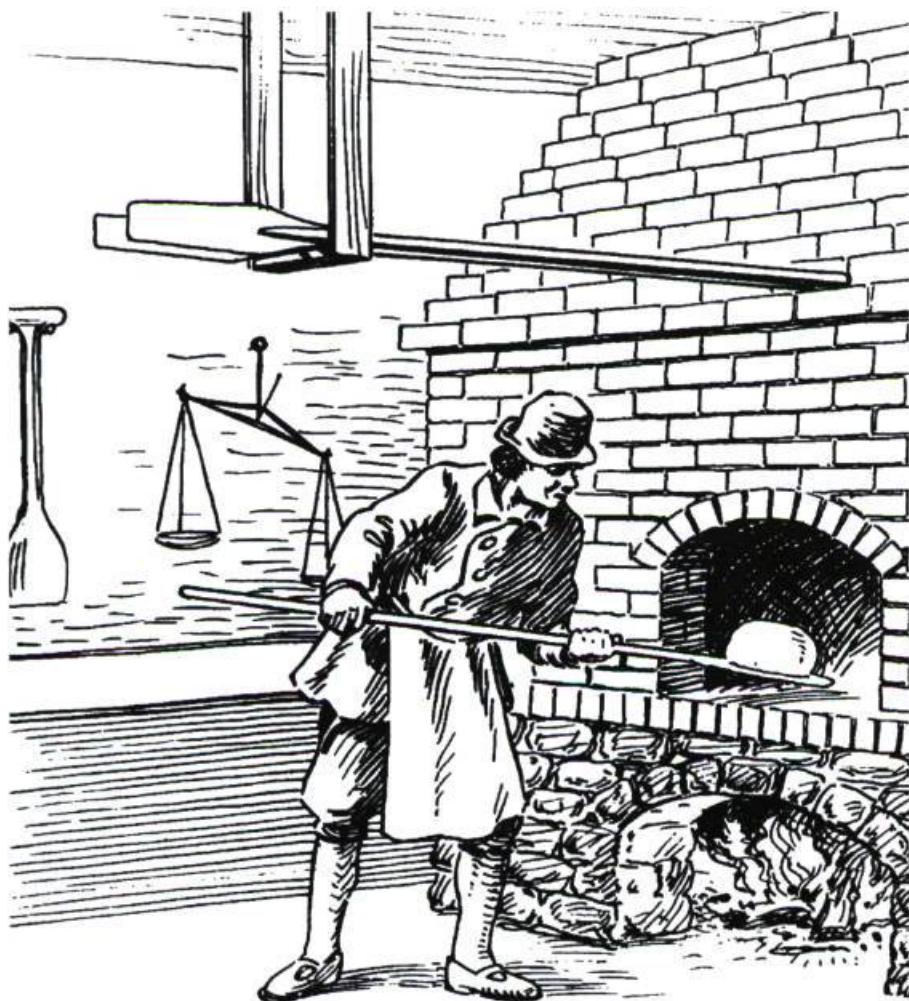
Archives publiques du Canada (C.W. Jeffreys)

Il y eut même des professeurs de grec et des arquebusiers. Et combien d'autres encore. ■