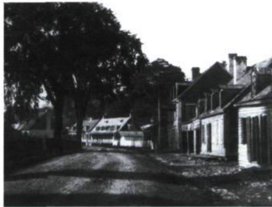
Le village des tanneries en 1865.

Que savons-nous donc au juste de ce scandale? Dans son Histoire de la province de Québec , l'historien Robert Rumilly évoque en ces termes le scandale des tanneries: