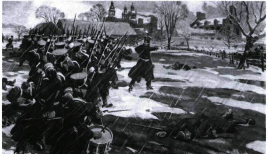
La bataille de Saint-Denis. C.W. Jeffreys

ou plutôt d'une barricade, parvienne en plus de mains, rafraîchisse des souvenirs semi-séculaires, et perpétue dans sa mesure une tradition glorieuse.