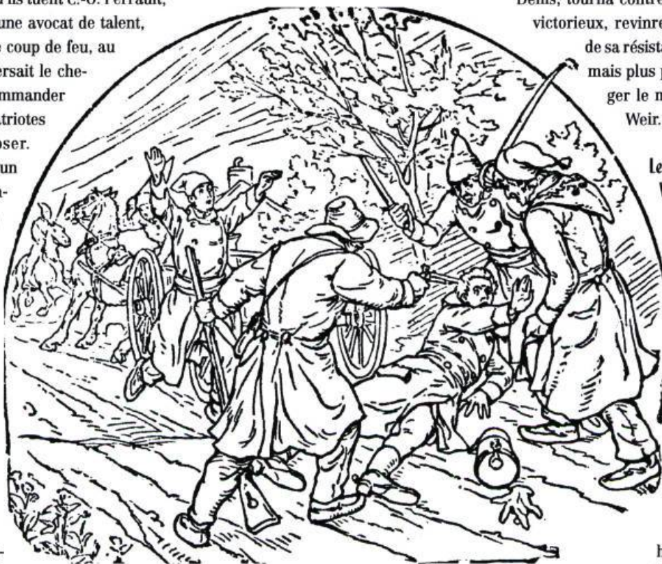
La mort de James Weir. Dessin d'Henri Julien

La victoire nous coûta cher; nous eûmes douze hommes tués et quatre blessés. Nos morts sont: