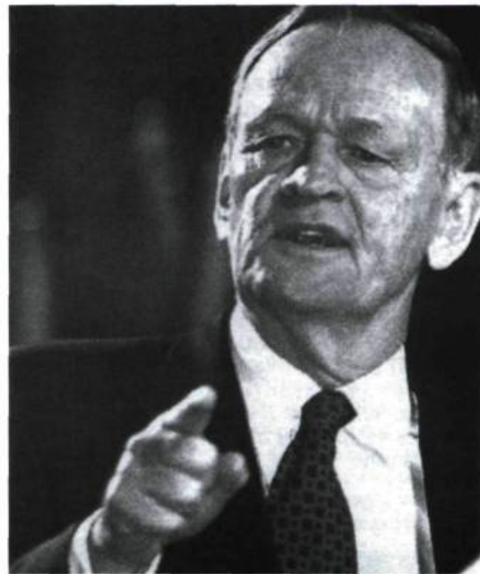
M. Jean Chrétien, premier ministre du Canada.