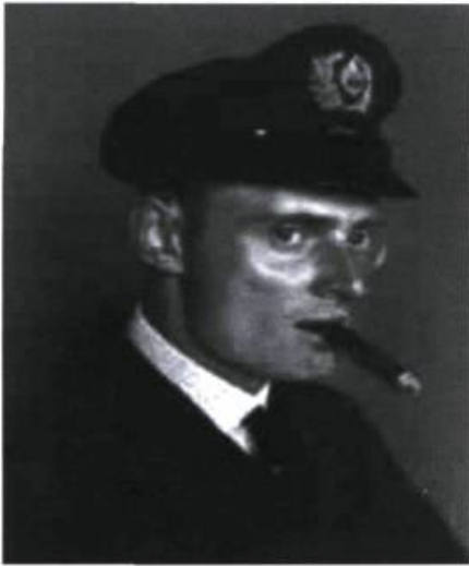
Le baron Ehrenfried von Huenefeld