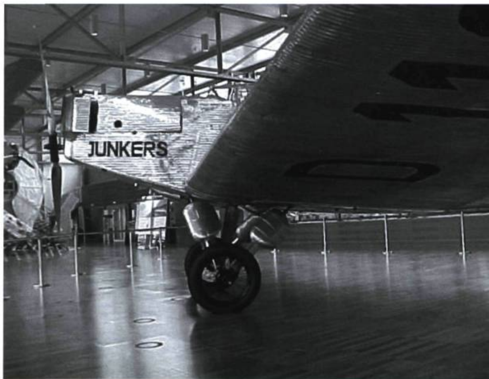
Le Bremen, devenu aujourd'hui une pièce d'histoire...

Tout se déroule sans encombre jusqu'au moment où le monoplan s'approche à quelque 640 kilomètres des côtes de Terre-Neuve. Les conditions météorologiques deviennent alors de plus en plus maussades. Les fameuses variations magnétiques de la région perturbent la navigation visuelle. C'est alors qu'un coup de vent d'une force inouïe frappe l'appareil et le projette directement dans le nuage malgré les manœuvres pour l'éviter. Ils décident donc de diminuer leur altitude et de combattre l'élément de la nature de la façon opposée. À quelque dix-huit mètres de la surface de la mer, une grosse vague surgit au-dessous d'eux, les obligeant à se redresser. Cette fois, ils sont entièrement à la merci de leurs instruments. Les difficultés s'accroissent lorsque l'éclairage des instruments tombe en panne et que l'on découvre une fuite dans le réservoir d'essence. Comme il fait nuit et qu'il est de venu