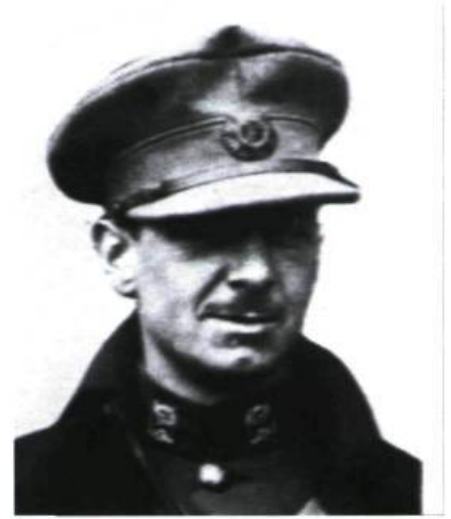
Le colonel James Fitzmaurice

dangereux de piloter à basse altitude, l'équipage préfère redresser l'appareil à 2000 mètres, en dépit du froid intense, de brouillard et de la neige. Il est impossible de voir scintiller la moindre étoile pouvant raviver l'espoir. Le doute s'installe. À ce moment, von Huenefeld, Koehl et Fitzmaurice voient disparaître leur chance d'atteindre leur destination : Mitchell Field, dans l'État de New York.