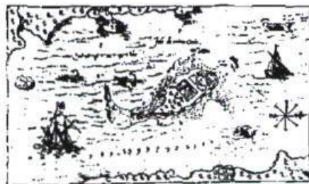
Carte de l'île Sainte-Croix, d'après Samuel de Champlain.

Il faut se rappeler que Louis Hébert est venu en Nouvelle-France durant la période la plus dure, celle des «conquistadors» qui exerçaient un monopole commercial de la fourrure. Lionel Groulx écrit : « Les mercantis ne veulent à aucun prix du plus modeste noyau de communauté humaine qui aurait fatalement ses intérêts propres, lesquels pourraient contrecarrer les intérêts du commerce... Ils abreuveront des pires avanies un colon têtue comme Louis Hébert » 7 . On comprend que Louis Hébert ait pu appuyer la cause des récollets qui demandaient au roi de ne pas en-