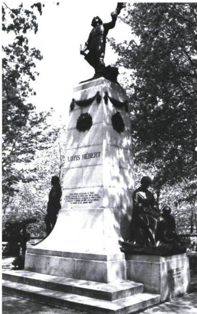
La statue de Louis Hébert, à Québec.