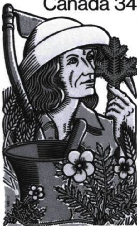
Louis Hébert apothicaire/apothecary

En 1985, la Société canadienne des postes rendait hommage à Louis Hébert non pas comme colon mais comme apothicaire. Cette émission voulait souligner le 45 e Congrès international des sciences pharmaceutiques, tenu à Montréal. (Design : Clermont Malenfant)