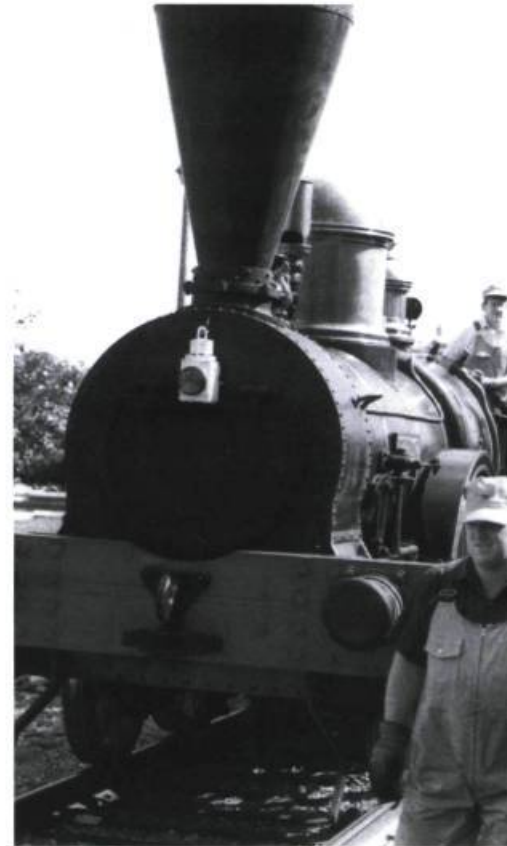
Une reconstitution de la Dorchester.

également l'île Moffat, du nom de son propriétaire, également actionnaire de la Champlain & St. Lawrence . Nul doute que les bonnes relations avec la seigneurie de la Couronne, La Prairie de la Magdeleine, ont facilité les transactions. Le baron Grant a un droit de regard, d'ailleurs, sur la partie du chemin de fer qui traverse la baronnie de Longueuil.