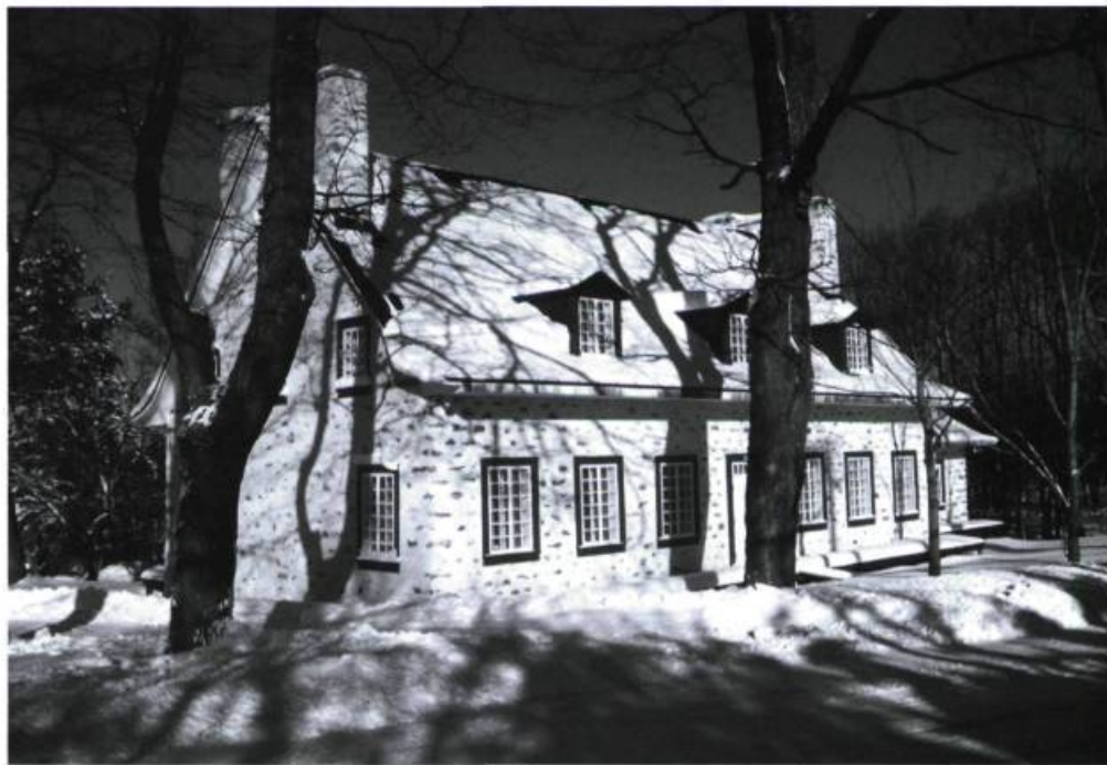
Le manoir seigneurial érigé par les Messieurs de Saint-Sulpice.

Mais pour bien comprendre la place du Manoir de Belle Rivière dans l'histoire régionale, il faut se rappeler que la plus grande partie de l'actuel comté de Mirabel a d'abord fait partie du comté de York puis du comté de Deux-Montagnes. Parmi les hommes qui le représentèrent à Québec, il y eut même deux premiers ministres... un certain Paul Sauvé dont on se souvient particulièrement bien dans la région, et Gédéon Ouimet, député du comté de 1867 à 1876, et premier ministre lui aussi en 1873 et 1874. Parmi les députés de jadis dont on