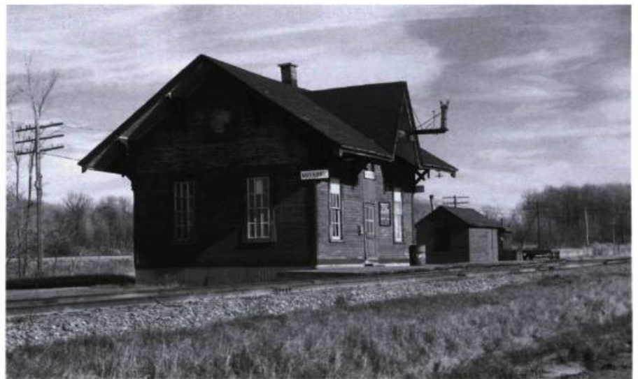
À mi-chemin entre l'église et le manoir, il y avait la gare, aujourd'hui disparue.

Si Jos Fortier l'emportait avec ses volailles, les Trappistes d'Oka raffaient presque tous les honneurs réservés... aux vaches et aux chevaux. Évidemment, ce Jos Fortier était un notable bien en vue de Sainte-Scholastique. Il y avait aussi ceux qui venaient pour les courses de chevaux... Mais ce qu'on voyait surtout dans les journaux, le lendemain, c'était la photo du député caressant voluptueusement la croupe d'une belle grosse Holstein.