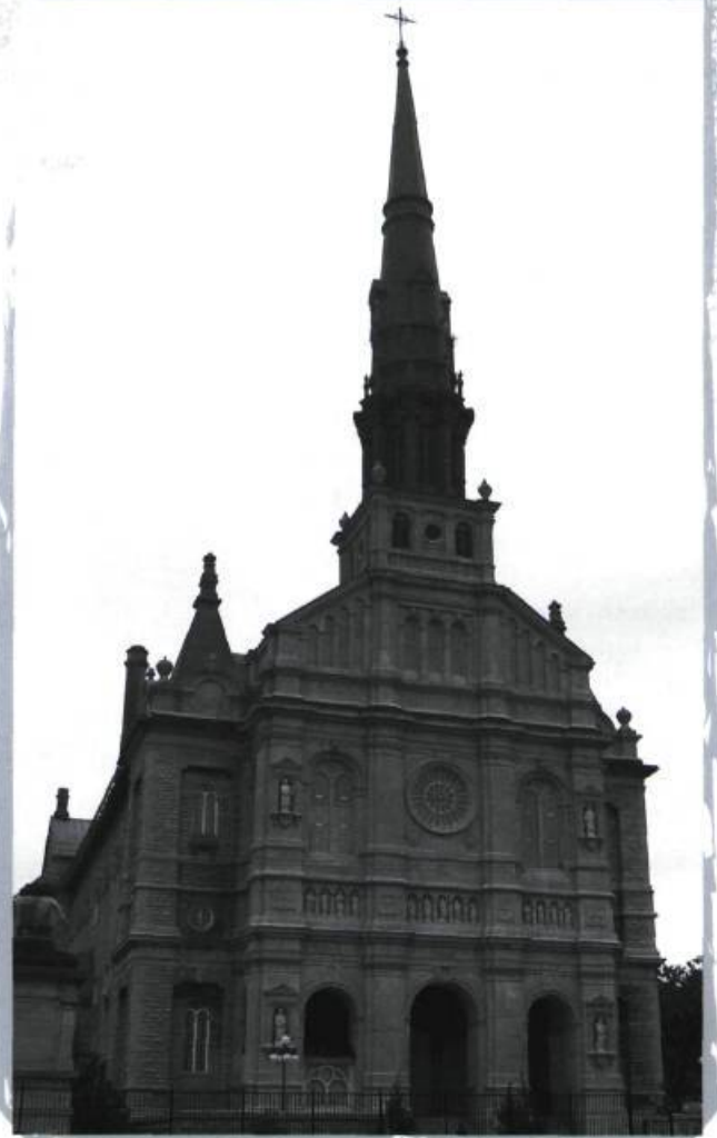
Église Saint-Jean-Baptiste de Québec. A

Compte tenu qu'il sera visiblement impossible de tout sauvegarder, il va falloir nécessairement effectuer des choix déchirants. Toutefois, ces choix, on doit les faire à partir de critères qui soient le plus raisonnables et objectifs possible, en tenant compte de la diversité culturelle et culturelle, mais aussi de divers autres facteurs comme l'aspect sociologique, les coûts, l'importance historique, l'implication de la communauté, la richesse architecturale et artistique, etc. On ne peut se contenter d'évaluer les bâtiments religieux en fonction seulement de leur ancienneté ou de leur aspect monumental, comme on semble l'avoir surtout fait jusqu'ici!... Voici donc, à titre indicatif, quelques-uns des éléments ou critères qui, selon la FSHQ, devraient être pris en considération lors de l'évaluation d'un bien patrimonial :