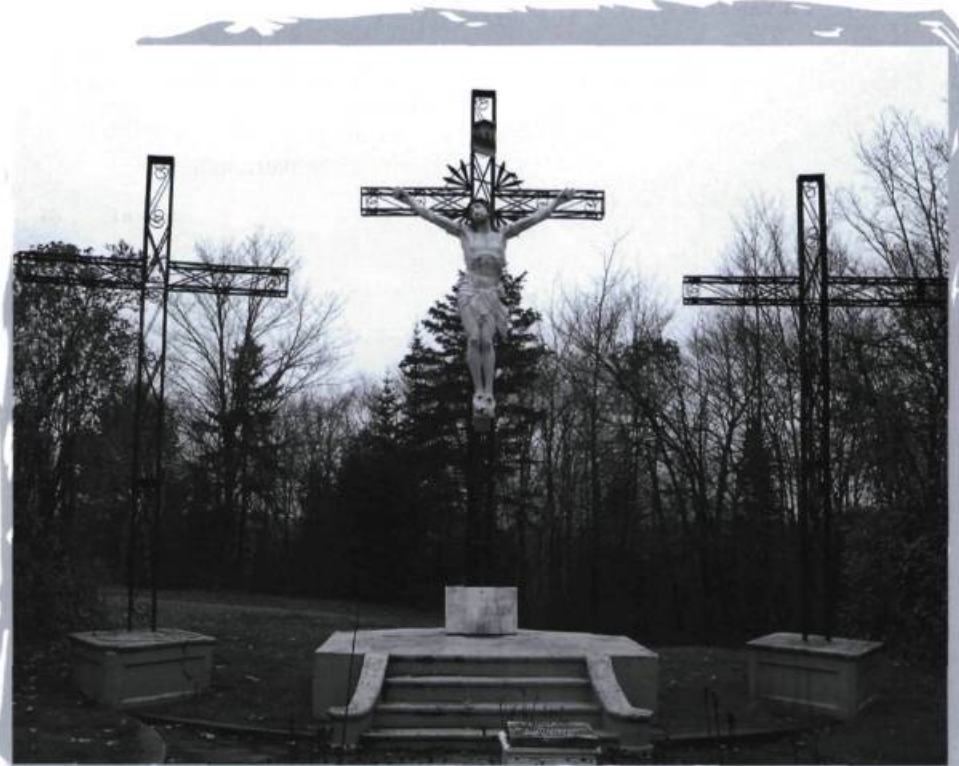
Chemin de croix sur la montagne, Saint-Élie-de-Caxton.

Par ailleurs, il n'est peut-être pas indispensable de modifier cette loi pour y parvenir, mais il est essentiel que, désormais, des spécialistes en patrimoine et en architecture patrimoniale soient consultés ou impliqués dans le processus décisionnel des conseils de fabrique en ce qui regarde l'entretien, la réparation et la restauration d'édifices patrimoniaux. Bon nombre d'édifices religieux sont présentement dans un état pitoyable et leur réfection sera extrêmement coûteuse. Pourtant, il y a quelque 20, 30 ou 40 ans, alors qu'on avait l'argent, on aurait pu prendre certaines décisions qui auraient évité une détérioration plus avancée de ces bâtiments. Dans d'autres cas, certaines réparations ont été effectuées, mais pas de la bonne façon, de sorte que des dommages importants ont été causés aux édifices. Tout cela, faute d'avoir consulté des experts en matière de patrimoine et d'architecture patrimoniale. Il importe qu'on ne répète plus ces erreurs.