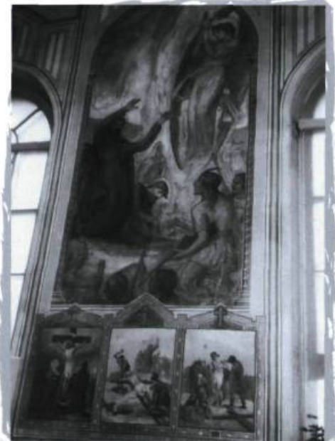
Œuvre d'Ozias Leduc, Notre-Dame-de-la-Présentation, Shawinigan-Sud. B