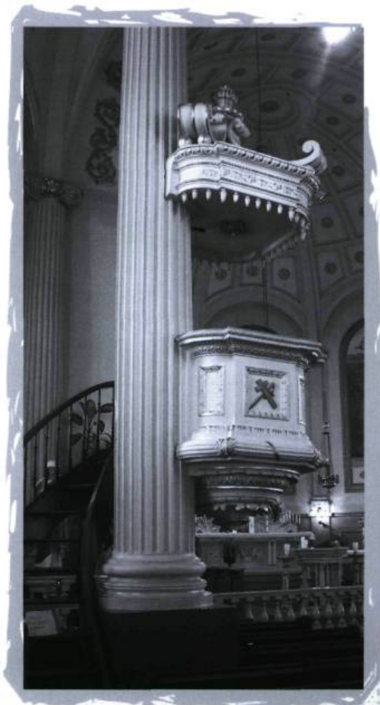
Chaire de l'église de Saint-Eustache.

Il est aussi essentiel que les municipalités se dotent d'outils appropriés pour prendre les décisions les plus pertinentes (comités de patrimoine, notamment) concernant ce patrimoine bâti et qu'elles veillent à ce que certaines décisions urbanistiques (zonage, plans d'implantation et d'intégration architecturale, normes de lotissement ou de paysagement, etc.) n'aient pas en bout de piste des effets négatifs sur les possibilités d'assurer la survie à long terme de ces édifices patrimoniaux.