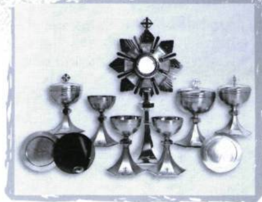
Ensemble de vases sacrés.

Il sera nécessaire, par ailleurs, que l'État exerce un rôle de leadership dans ce dossier, ne serait-ce qu'en assurant une meilleure concertation des divers ministères et organismes qui s'y rattachent, ou en mettant sur pied des équipes de spécialistes pouvant aider les gestionnaires d'édifices patrimoniaux à prendre les décisions les plus éclairées et les plus appropriées, ou même en stimulant la formation spécialisée dans certains métiers en voie de disparition ou en s'assurant que certains professionnels