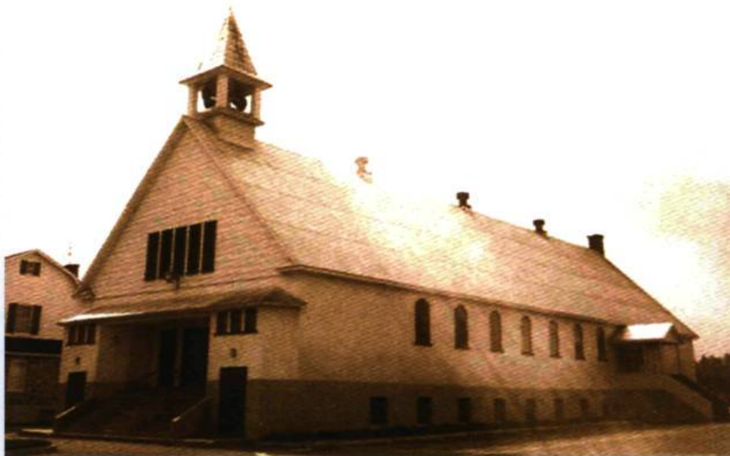
Église Sainte-Françoise-Cabrini.