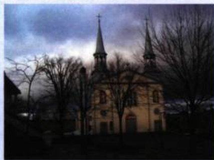
Église Saint-Charles-Borromée de Charlesbourg.

« Dans ces "temps anciens", les paroisses au nord de la ville de Québec n'étaient pas nombreuses; la paroisse de Charlesbourg était bornée au sud par la paroisse St-Roch de Québec, à l'est par la paroisse de Beauport et à l'ouest par la Paroisse de l'Ancienne-Lorette. Au nord, la paroisse de Charlesbourg s'étendait jusqu'à l'arrière pays... du Saguenay (...) les débuts de Charlesbourg remontent à 1660. » 2 .