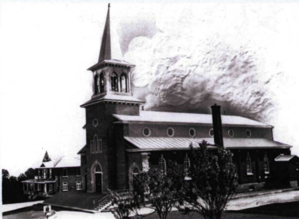
Église Saint-Émile martyr.