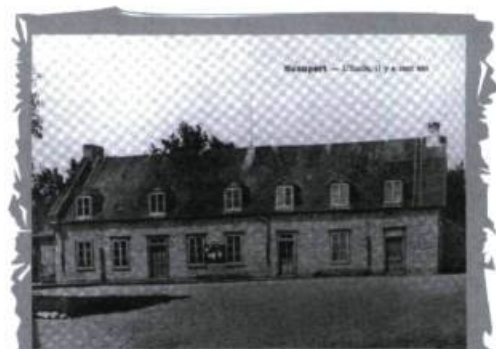
La Maison de la fabrique ou salle paroissiale telle qu'elle était avant sa démolition en 1953.

Les fouilles archéologiques sur la place de l'église de La Nativité de Notre-Dame à Beauport auront permis d'identifier de nombreuses autres traces d'établissement sur la place de l'église. Ainsi, l'emplacement du presbytère érigé en 1812 à la demande du curé VanFelson a été localisé à quelques mètres de la façade de l'église actuelle. Son abandon devait être décidé au début des années 1860 en raison de la crainte qu'inspiraient les flèches branlantes de la nouvelle église construite dix ans auparavant. C'est à ce moment que fut construit le presbytère actuel 17 . Au moins deux autres bâtiments ont également été trouvés sur le site, sans compter une fosse à déchets du milieu du XVIII e siècle, des éléments de construction associés à la troisième ou à la quatrième église, ainsi que des surfaces de circulation. Les artefacts couvrant toute la période d'occupation des différents bâtiments ont aussi été retrouvés en très grand nombre. Ainsi, les fouilles archéologiques ont permis de révéler de nouveaux indices de la riche histoire des habitants de Beauport!