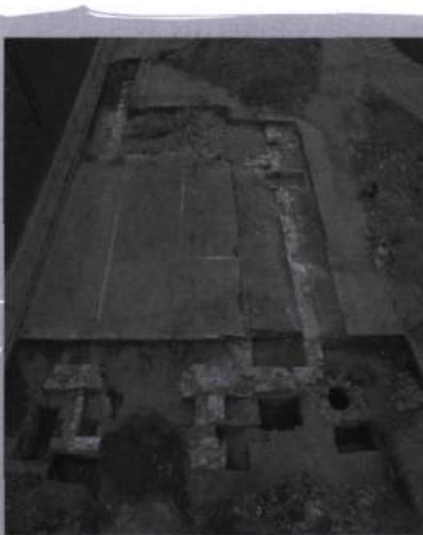
Vue générale des nombreux vestiges trouvés dans l'aire du presbytère et de la salle paroissiale.

Plusieurs indices de la présence des cimetières anciens de la paroisse ont été identifiés au cours des dernières années et plusieurs plans anciens fournissent des indications quant à l'emplacement de cimetières et particulièrement concernant celui en usage entre 1720 et 1879. Déjà, en 2004, les travaux effectués sur la rue du Fargy 9 , à l'arrière de l'église actuelle, avaient permis de visualiser partiellement les limites nord, sud et est de ce cimetière; il aurait entouré partiellement l'enceinte du temple