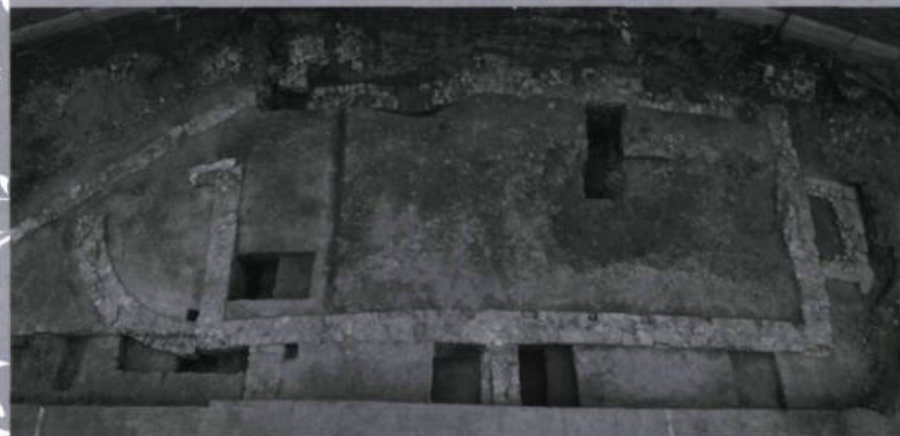
Vestiges de la première église en pierre de Beauport (1672-1722).