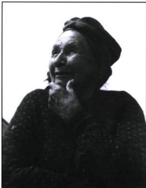
« Joie Montagnais ».