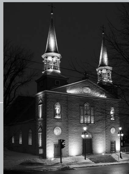
Façade illuminée de l'église Saint-Charles-Borromée, située au 747, boulevard Louis XIV, dans l'arrondissement de Charlesbourg, à Québec.