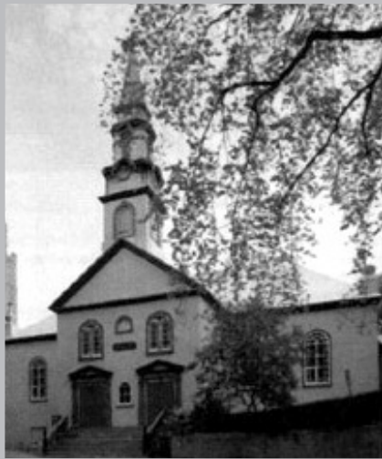
Église St. Andrew, Québec.