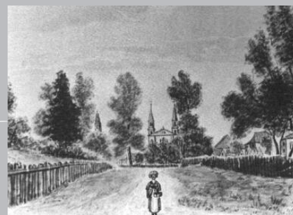
Cette oeuvre nous permet d'apercevoir, au travers des branches, le clocher de la première église. (Source : Aquarelle de James Patterson Cockburn, 1830)