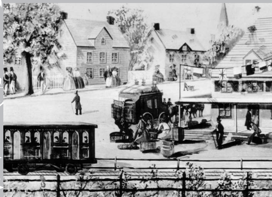
Vers 1845-1850, un train quitte la gare de Saint-Jean avec les passagers amenés par la diligence des villages environnants.