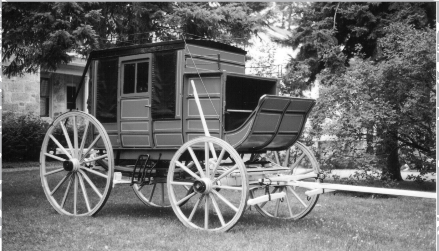
Diligence Concord utilisée à Stanstead vers 1890 et toujours en état de marche.

Les entreprises de diligences, encouragées d'ailleurs par les compagnies ferroviaires et surtout par le département des Postes, trouvent une nouvelle vocation à leurs voitures : celle d'assurer le transport de la clientèle ferroviaire et du courrier vers les gares et de desservir les arrière-pays trop peu peuplés pour justifier la construction de voies ferrées.