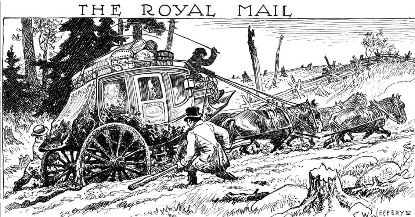
Royal Mail. Malle-poste embourbée. Pendant que le conducteur fouette ses chevaux, deux passagers qui pataugent dans la boue tentent de l'assister.

Les plus anciennes voitures connues au Bas-Canada roulent entre La Prairie et Saint-Jean en 1792 et 1793. En 1799, John C. Ogden, un voyageur étranger, emprunte la malle-poste de Saint-Jean à Montréal, puis celle de Montréal à Québec, qui circule