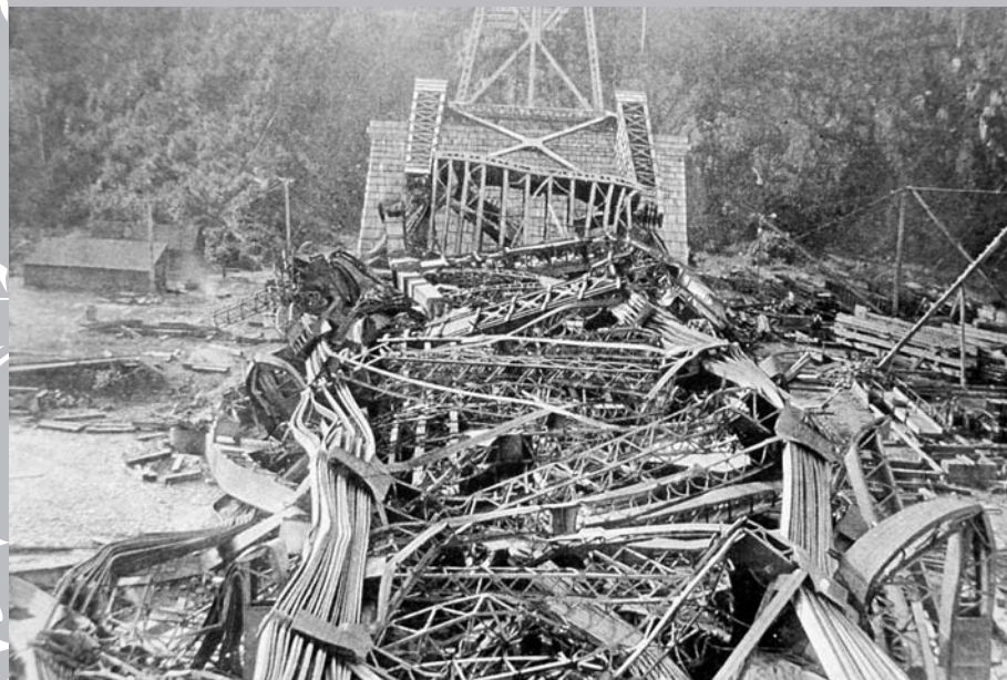
Écroulement du pont de Québec survenu le 29 août 1907, causant la mort de 76 ouvriers.

Le 2 octobre 1900, Sir Wilfrid Laurier et Simon-Napoléon Parent donnent le coup d'envoi à la construction du pont de Québec qui doit être érigé par la Phoenix Bridge Co. de Phoenixville, Pennsylvanie. Au cours de l'érection, des problèmes se multiplient dans la structure; les ouvriers rencontrent des difficultés à aligner des pièces et constatent même que plusieurs se courbent, ce qui aurait dû