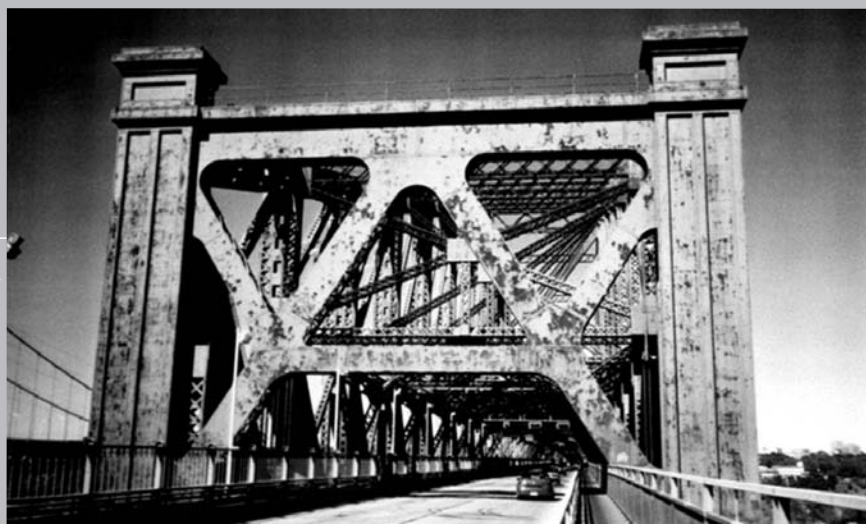
Photo prise en 1995 montrant le pont de Québec envahi par la rouille qui se fait de plus en plus présente sur la structure.

En terminant, il faut espérer que ce nouvel épisode dans l'histoire mouvementée du pont de Québec connaisse un dénouement heureux. Cette œuvre de génie civil jouit de tout le potentiel nécessaire pour redevenir une attraction d'envergure et un joyau de l'industrie touristique régionale, s'il est préservé et mis en valeur comme il le mérite.