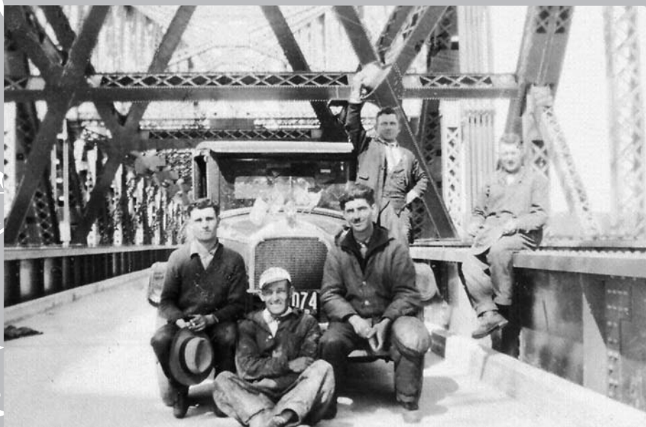
Ouverture de la première voie carrossable sur le pont de Québec, le 22 septembre 1929.

de 1917, le pont met la ville et la région en communication directe avec la rive sud du Saint-Laurent et les États-Unis, et rend ainsi possible l'entrée dans la ville de Québec de nombreuses compagnies de chemin de fer qui sillonnaient jusqu'alors la rive sud.