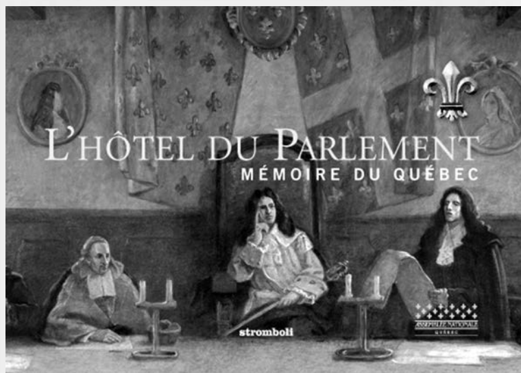
Couverture du livre L'Hôtel du Parlement, mémoire du Québec . (Photo : Gaston Deschênes)

M. Deschênes, ce fut pour moi un réel plaisir de bavarder pendant quelques heures avec vous. Je tiens à vous féliciter très sincèrement pour toutes ces années consacrées à la diffusion de l'histoire.