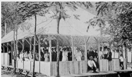
Pavillon de danse à Coney island, près de Windsor (vers 1905) Les lieux de loisirs et de plaisirs se multiplient au début du XX e siècle, malgré les mises en garde répétées du clergé catholique.

Les Américains sont les fils des Révolutionnaires de 1776. Ils sont le premier peuple colonisé à avoir arraché par les armes leur indépendance. Ils privilégient la démocratie locale, de proximité, par laquelle les individus libres et propriétaires consentent à se taxer pour se doter de routes ou d'écoles. Ils ont un sens de la liberté individuelle, de l'initiative et se méfient de l'étatisme.