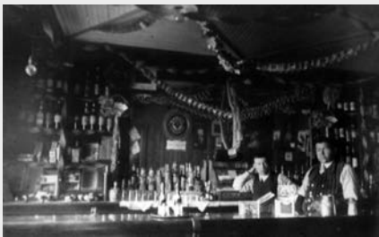
Le bar de l'hôtel du Canadien Pacifique à Lac-Mégantic vers 1900 est bien fourni! Le clivage entre Canadiens français et Anglo-protestants au Conseil municipal des villages de Mégantic et d'Agnès fera se succéder en peu d'années périodes de prohibition totale et systèmes de licences.

Leur sentiment religieux est plus à l'aise dans les églises évangéliques, les sectes ou les dissidences.