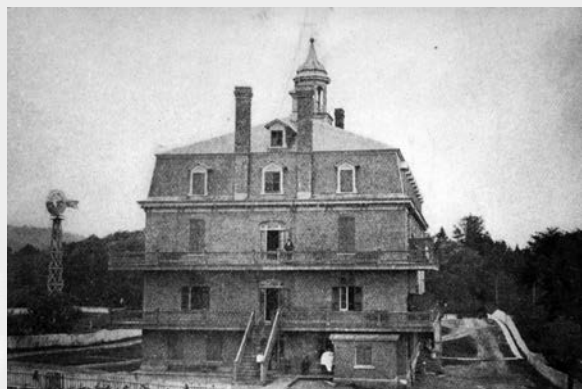
Hospice du Sacré-Cœur sur la rue Belvédère Sud en 1898.

Une prochaine recherche nous permettra d'analyser comment ce mouvement d'implantation des communautés religieuses dans le diocèse de Sherbrooke peut se comparer avec le portrait des congrégations en général dans l'ensemble du Québec.