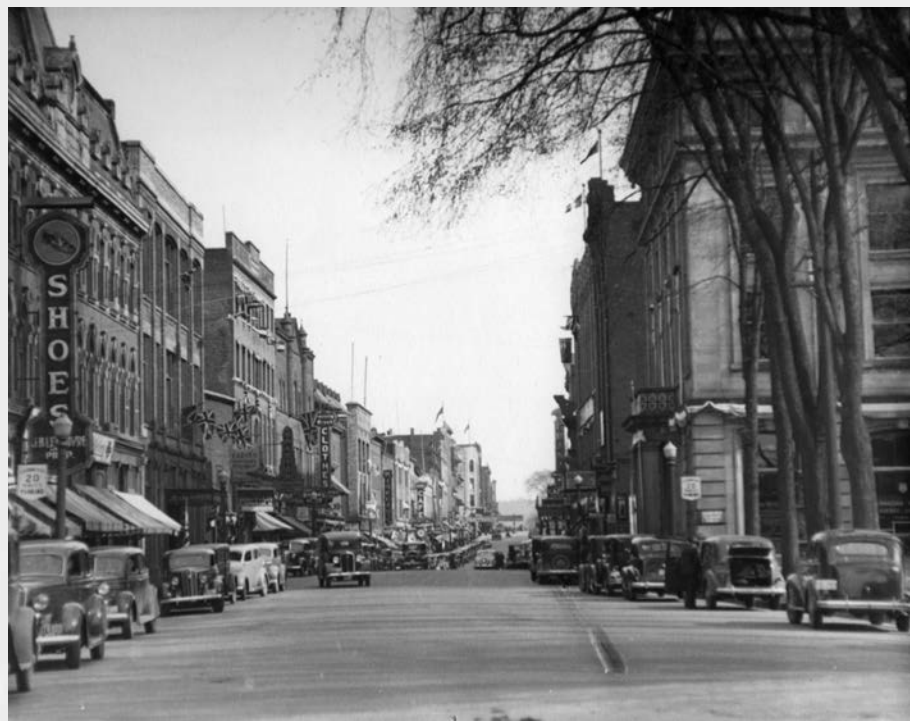
Vue sur la rue Wellington, cœur du centre-ville de Sherbrooke, dans les années 1930.

Sur le plan de la politique, il y aurait intérêt à mieux intégrer la notion de gouvernance, c'est-à-dire l'idée d'un pouvoir politique qui déborde les murs des institutions traditionnelles pour englober des acteurs comme les chambres de commerce, les associations de citoyens, les syndicats ou les promoteurs immobiliers.