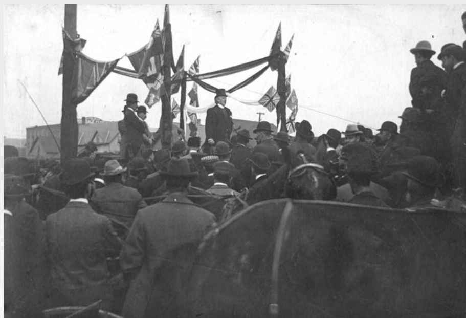
Wilfrid Laurier s'adresse à une foule de partisans de Sherbrooke en 1919.

informée par le rôle que ces dernières peuvent et devraient jouer dans ce contexte.