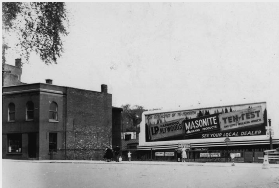
"For the homes of to-morrow", publicité affichée à l'intersection des rues Wellington Nord et Frontenac en 1954.

Il y a également un certain nombre de causes plus prosaïques, comme l'accès aux sources. L'histoire se fait à l'aide de documents de toutes sortes et les grandes entités ont tendance non seulement à en produire plus, mais elles disposent également des ressources nécessaires pour les conserver et les rendre facilement accessibles. Dans les petites localités, les choses sont souvent plus aléatoires. Le chercheur dépend alors de la bonne volonté de l'archiviste qui est en poste ou alors du dynamisme des associations locales et, au premier chef, des sociétés d'histoire. Ajoutons que, si on se fie aux bilans que j'ai évoqués plus tôt, chercheurs et étudiants sont plus enclins à étudier ce qui est