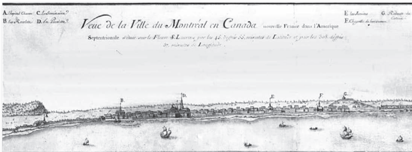
Vue de la Ville du Montréal en Canada, anonyme

La ville ne possède pas encore l'eau courante, non plus que du pavage ou un éclairage extérieur. En revanche, Montréal est ni plus ni moins que la plaque tournante du commerce, car elle ouvre ses portes vers ces lieux mythiques que sont les Pays-d'en-Haut et sa situation géographique la place au confluent d'importantes voies de navigation telles que le Richelieu et l'Outaouais. En plus des fourrures lucratives qu'acheminent les voyageurs, elle engrange bientôt, grâce aux concessions environnantes qui sont placées sous sa juridiction, des surplus agricoles qui sont aussitôt écoulés sur les marchés de Québec