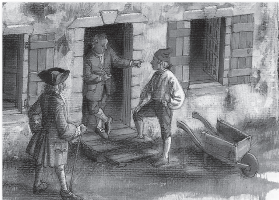
Trois Montréalais (détail) (Crédit : Illustration : Francis Back©)

On dit également des Canadiens qu'ils sont très pieux. C'est en tout cas ce qui ressort du témoignage de Kalm, mais il est loin d'être le seul à avoir relevé ce trait, car de fait, l'encadrement religieux est rigoureux et assez strict dans les petites villes coloniales. En revanche, les doléances nombreuses des curés et la foison des délits inscrits dans les archives judiciaires (65% des accusations sont enregistrées à Montréal) nous rappellent qu'une certaine propension à l'insubordination et à la « dissipation des moeurs » caractérise la population montréalaise, phénomène qui,