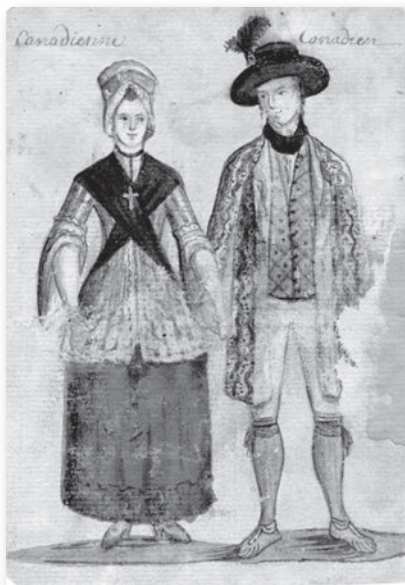
Couple de Canadiens, XVIII e siècle, anonyme

On vante également leurs habiletés manuelles et leur goût pour les «arts mécaniques», témoin, l'abbé Louis-Bertrand de La Tour qui admire la dextérité exceptionnelle des ouvriers où «les moindres enfants montrent de l'adresse». L'appréciation est la même de la part de Charlevoix qui remarque qu'ils n'ont besoin ni de maîtres, ni d'apprentissage pour exceller dans tous les métiers, un constat repris par l'intendant Hocquart qui note que «la nécessité les a rendus industriels de génération en génération. Les habitants font eux-mêmes la plupart des outils et des ustensiles de labour, bâtissent leurs maisons, leurs granges, etc.» De même, les femmes canadiennes sont décrites par Pehr Kalm, un botaniste d'origine finlandaise de passage au Canada en 1749, comme étant plus industrieuses que celles de la Nouvelle-Angleterre : «Le matin, elles sont levées avant le diable en personne et le soir nul ne peut les trouver au lit.»