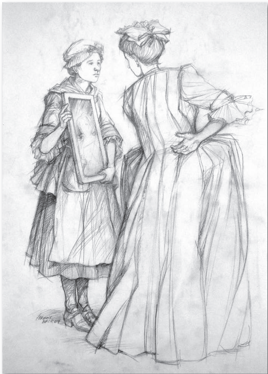
Dame de la noblesse (esquisse) (Crédit : Illustration : Francis Back©)

leur aristocratie. Ce n'est pas le cas des Montréalaises, plus isolées, qui ne sont pas aussi exposées aux « bienfaits de la civilisation » et auxquelles on attribue « l'orgueil des Indiens », voire un manque d'étiquette et de décorum. En revanche, Kalm remarque qu'elles « sont moins frivoles », ce qui, néanmoins, ne les empêche aucunement d'être « gaies et contentes » Poursuivant la comparaison entre Québécoises et Montréalaises, il ajoute que ces dernières lui semblent plus jolies et plus chastes que leurs consoeurs de la capitale.