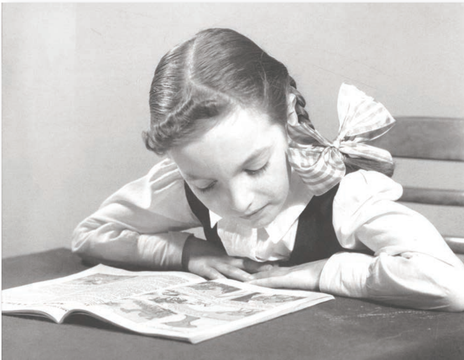
Jeune fille de Québec absorbée dans sa lecture d'une revue écolière en 1950.

Avec un budget de 452 millions de dollars, le ministre de l'Éducation a réussi à accaparer le plus gros budget parmi les différents ministères, ce qui attire l'animosité des autres ministres du gouvernement, qui voient leurs projets sacrifiés