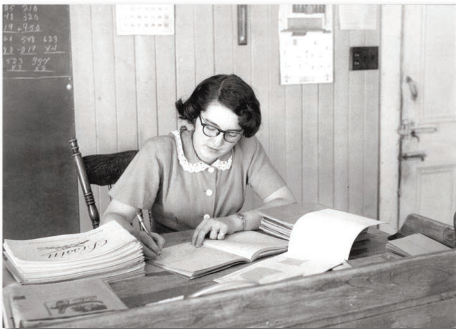
Institutrice corrigeant les travaux des enfants à l'école de rang de Saint-Henri-de-Lévis en 1952.

« Finalement, la ténacité et l'habileté du surintendant Victor Doré parviennent à vaincre les hésitations de l'Église devant toute mesure coercitive. [...] En 1943, la loi [...] est adoptée par le gouvernement libéral d'Adélard Godbout. En vigueur pour la rentrée scolaire, elle oblige les parents à envoyer à l'école leurs enfants de 6 à 14 ans, et cela sous peine d'amendes. La loi abolit aussi les frais de scolarité à l'élémentaire et instaure la gratuité des manuels. » 10