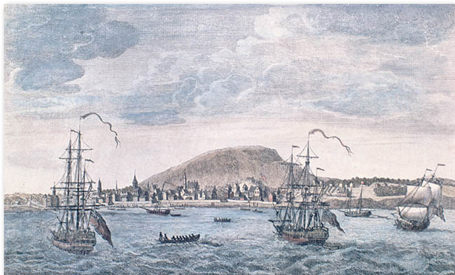
Une vue de l'est de Montréal, au Canada, par Thomas Patten, le 11 novembre 1762.

La majorité des Acadiens contribuèrent à fonder, entre 1755 et 1775, des petites Cadies , villages fondés par des Acadiens où la très grande majorité de la population était d'origine acadienne. Ces petites Cadies sont Saint-Gervais, Bonaventure, Saint-Grégoire (à Bécancour), Saint-Jacques, L'Acadie (à Saint-Jean-sur-Richelieu) et Carleton.