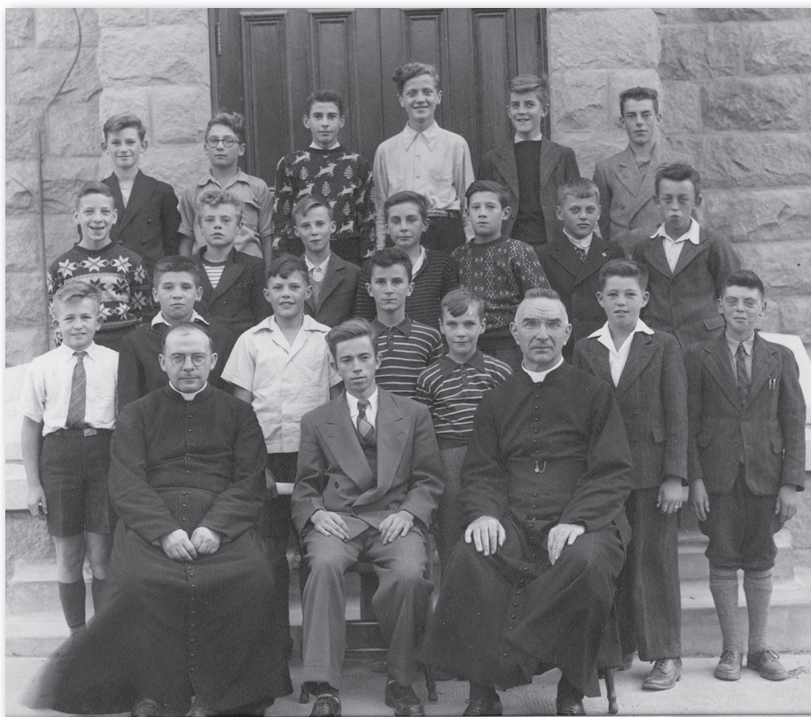
Classe de l’École presbytérale, 1948, Fonds Collège classique de Thetford – Centre d’archives de la région de Thetford.

1966-1967, pour l’admission des filles comme élèves. Finalement, le Collège classique de Thetford connaît sa dernière rentrée scolaire en septembre 1968. Le rapport Parent prônant la disparition du cours classique, le bâtiment accueille, à partir de l’automne 1969, les étudiants du nouveau Collège d’enseignement général et professionnel de Thetford Mines.