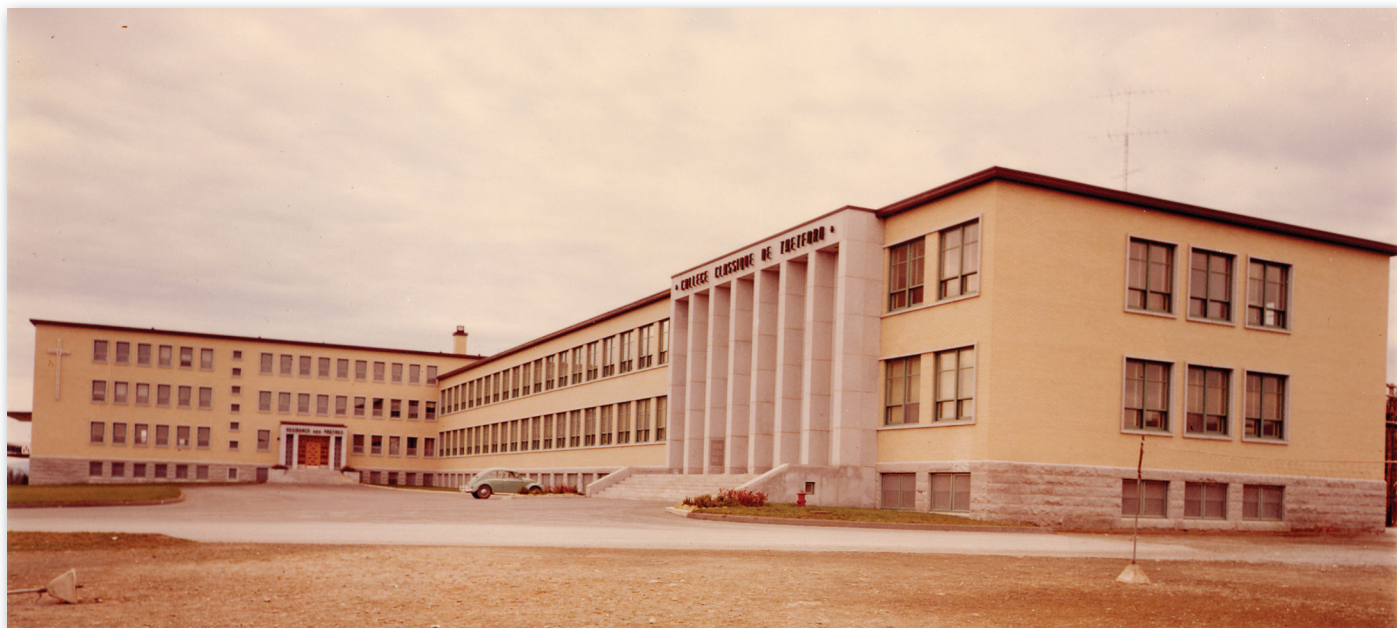
Collège classique de Thetford à la fin des années 1960

Après plusieurs années d'attente, l'institution s'installe dans son nouveau bâtiment situé sur le boulevard Smith, aujourd'hui Frontenac, à l'automne 1959. Toutefois, il faut patienter encore deux ans pour que le Collège offre le programme complet du cours classique et jusqu'à l'année