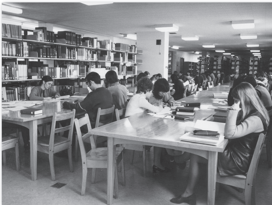
Étudiants à la bibliothèque à la fin des années 1960, Fonds Collège classique de Thetford – Centre d’archives de la région de Thetford.