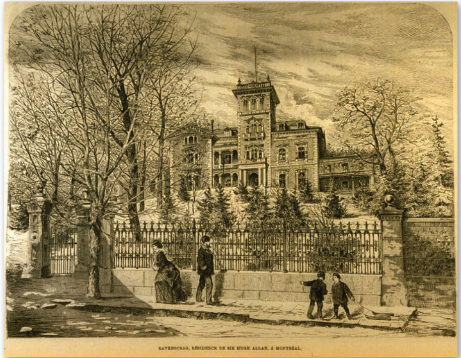
Ravenscrag, Sir Hugh Allan.

Le Dictionnaire biographique du Canada, de même que les archives de l'état civil, recèlent une multitude de détails relatant les faits et gestes des premiers Écossais.