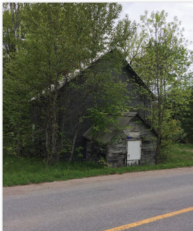
Loyal Orange Lodge N° 46, Bristol, collection personnelle, Wes Darou, juin 2018.

Située au 17, chemin Shouldice, à La Pêche, cette loge est décrite dans une masse de documents du fonds D' Stuart Geggie, au Centre régional d'archives de l'Outaouais 26 . Cette bâtisse servait aussi d'école, donc il y a deux portes, une était pour les filles et l'autre pour les garçons. Aujourd'hui, elle aussi est une résidence.