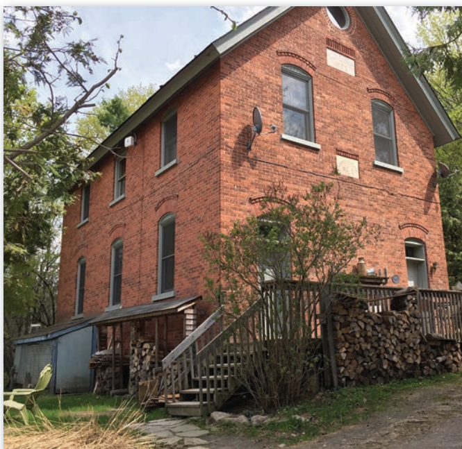
Loyal Orange Lodge N° 28, Rupert, collection personnelle, Wes Darou, avril 2018.