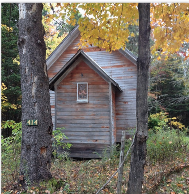
Loyal Orange Lodge N° 67, Greermount, avril 2018.