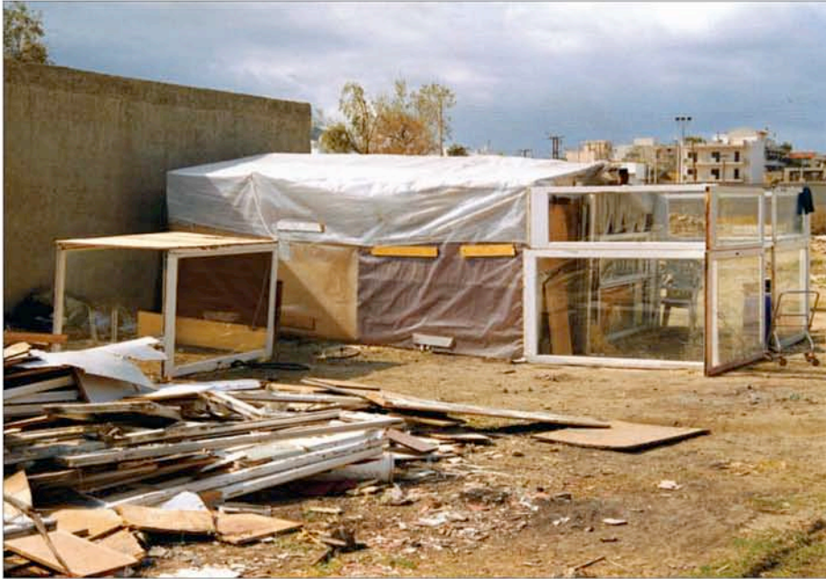
T.A.M.A. (Temporary Autonomous Museum for All): Sans titre , 2000. Tirage Lambda, 1,26m x 1,80m, tiré à 5 exemplaires. Collection privée.