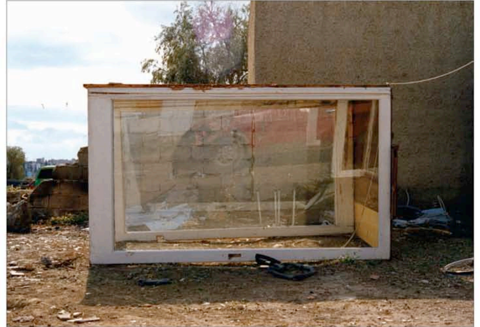
T.A.M.A. (Temporary Autonomous Museum for All): Sans titre , 2000. Tirage Lambda, 1,26m x 1,80m, tiré à 5 exemplaires. Collection privée.