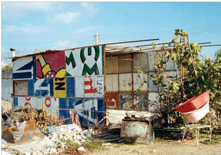
T.A.M.A. (Temporary Autonomous Museum for All): Sans titre , 2000. Tirage Lambda, 1,26m x 1,80m, tiré à 5 exemplaires. Collection privée.