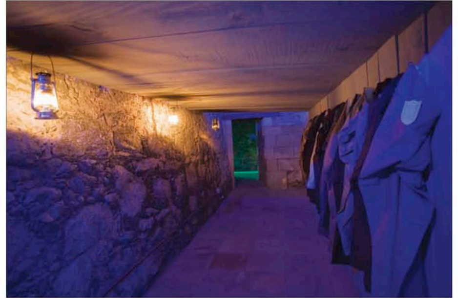
Hotel Plug-Inn: Check-in Room, 2006. Morceaux de bateaux abandonnés, vêtements, lampes à l'huile.