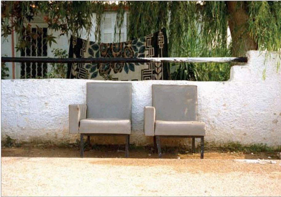
T.A.M.A. (Temporary Autonomous Museum for All): Sans titre , 1998. Tirage Lambda, 1,26m x 1,80m, tiré à 5 exemplaires. Collection privée.