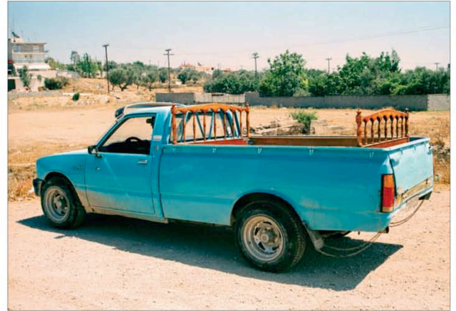
T.A.M.A. (Temporary Autonomous Museum for All): Luv Car ( TransBonanza Platform for Public Events ), 2003. Sculpture publique, dimensions variables. Avec l'aimable permission de l'artiste.