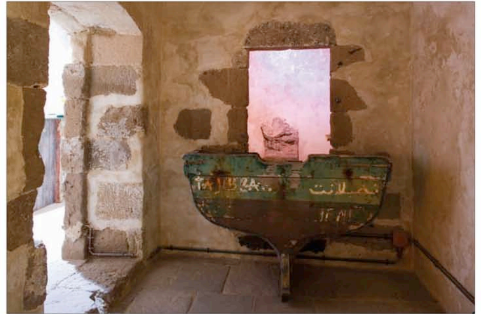
Hotel Plug-Inn: Room to make a wish , 2006. Morceaux de bateaux abandonnés, tissu blanc, pièces de monnaie. Avec l'aimable permission de la Biennale des Îles Canaries et de l'artiste.