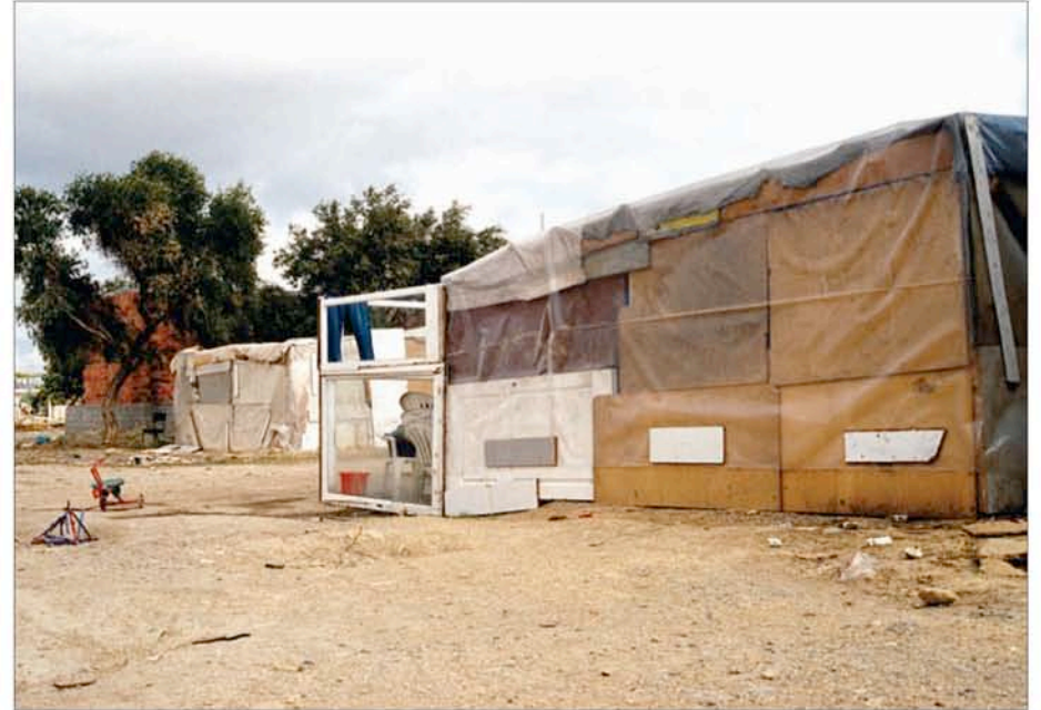
T.A.M.A. (Temporary Autonomous Museum for All): Sans titre , 1999. Tirage Lambda, 1,26m x 1,80m, tiré à 5 exemplaires. Collection privée.