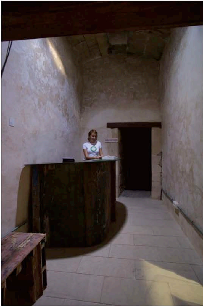
Hotel Plug-Inn: Reception , 2006. Morceaux en bois provenant de bateaux abandonnés par des immigrants illégaux, livres et extraits de journaux, photographies sur la migration illégale vers les Îles Canaries. Avec l'aimable permission de la Biennale des Îles Canaries et de l'artiste.