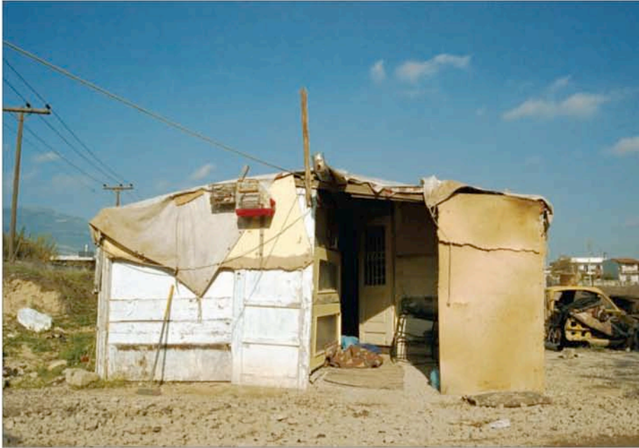
T.A.M.A. (Temporary Autonomous Museum for All): Sans titre , 1999. Tirage Lambda, 1,26m x 1,80m, tiré à 5 exemplaires. Collection privée.