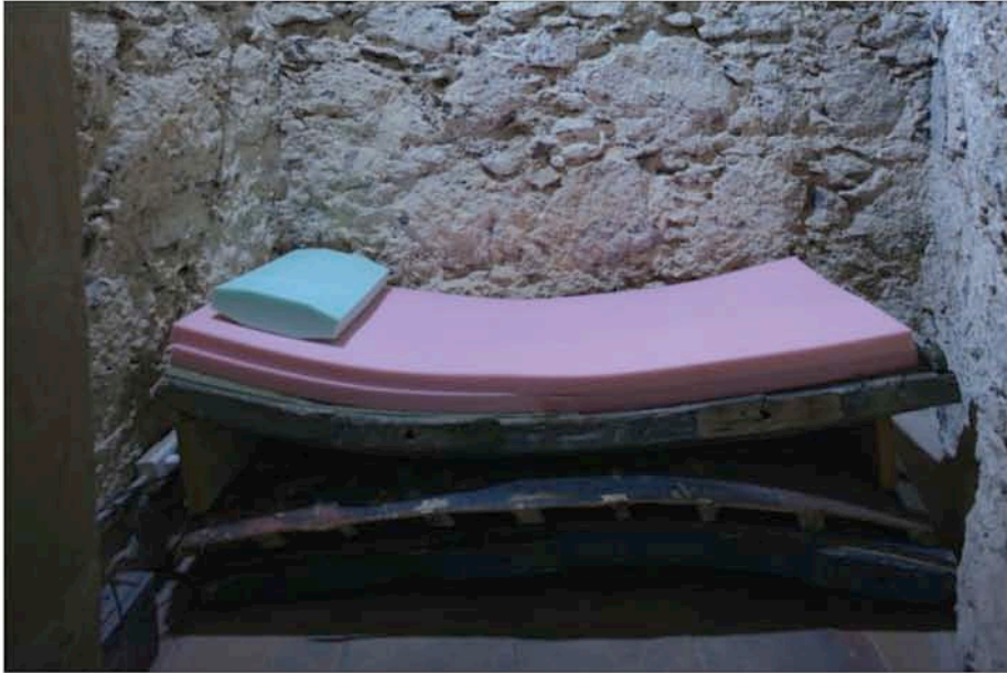
Hotel Plug-Inn: Single room, 2006. Morceaux de bateaux abandonnés, caoutchouc mousse.