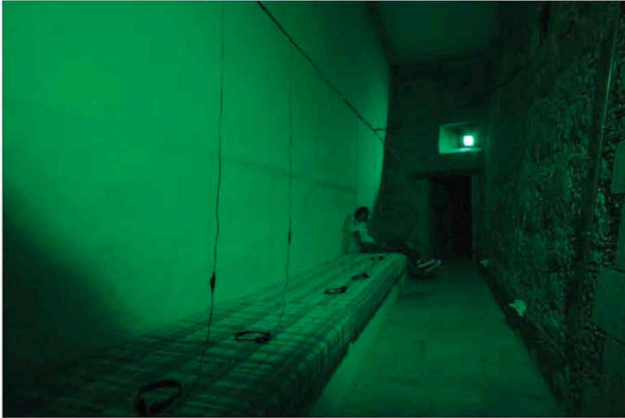
Hotel Plug-Inn: The Sound Room, 2006. Matelas, écouteurs, simulation des bruits de la jungle.