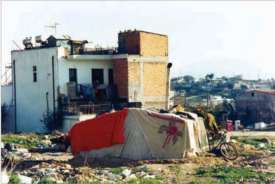
T.A.M.A. (Temporary Autonomous Museum for All): Sans titre , 1998. Tirage Lambda, 1,26m x 1,80m, tiré à 5 exemplaires. Collection privée.