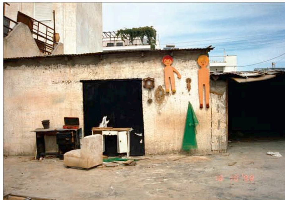
T.A.M.A. (Temporary Autonomous Museum for All): Sans titre , 2000. Tirage Lambda, 1,26m x 1,80m, tiré à 5 exemplaires. Collection privée.