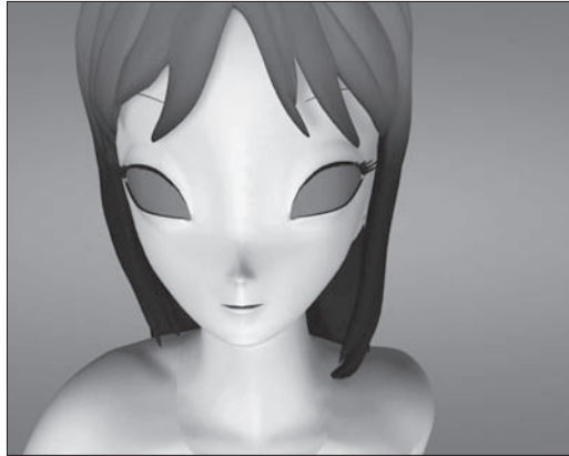
Fig. 5. Pierre Huyghe, Two minutes Out of Time , 2000, Beta digital, 4 minutes.

le nom d'Annlee, s'est ainsi métamorphosée à l'intérieur de plusieurs œuvres (fig. 5). Sortie de la fiction, elle entre dans un autre monde, un monde de récits qui prolifèrent dans une zone instable entre fiction et réalité. Si dans chacun des remakes la question de la narrativité est implicitement liée à une critique de l'industrie cinématographique, ici ce sont les impératifs commerciaux du jeu qui sont perçus comme exerçant une emprise sur la fiction, sur l'imaginaire.