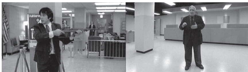
Fig. 4. Pierre Huyghe, The Third Memory , 1999, double projection, Beta digital, vidéo sur moniteur, 9 minutes.

leurs conditions de scénarisation, de production et de diffusion 18 et, pourrait-on ajouter, par le genre lui-même — que l'on connaît aujourd'hui sous le vocable de « cinéma vécu » — qui se développe à Hollywood durant les années 1970. C'est d'ailleurs cette industrie que l'auteur du « vrai » crime affronte lorsque, après la sortie du film, il engage des démarches pour « corriger » la fiction et faire valoir son histoire telle qu'elle s'est véritablement déroulée le jour du hold-up .