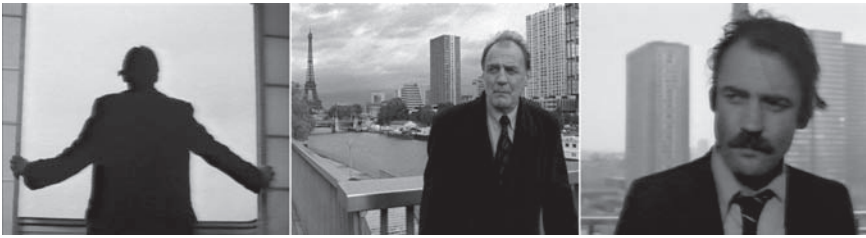
Fig. 3. Pierre Huyghe, Ellipse , 1998, triple projection, S16, Beta digital, son, 13 minutes.

Remake, Versions multiples (Atlantic – Atlantik – Atlantis, 1929) et Ellipse