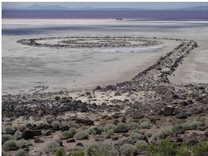
Figure 1 : Robert Smithson, Spiral Jetty , Great Salt Lake, Utah, 1970.