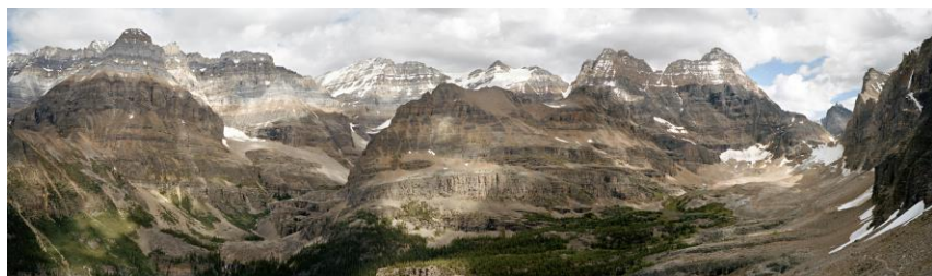
Figure 5a-5b : Andreas Rutkauskas, N 45^{\circ} 28' 34'' W 73^{\circ} 37' 18'' , 2010, 61 x 209 cm et N 51^{\circ} 20' 51'' W 116^{\circ} 20' 31'' , 2010, 61 x 209 cm. De la série Virtually There . Avec l'aimable autorisation de l'artiste.