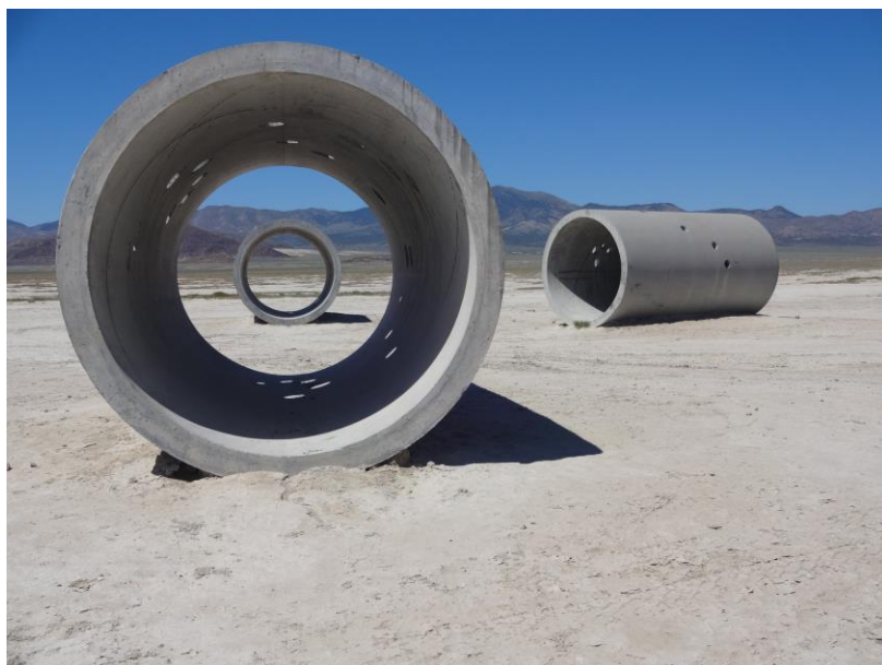
Figure 2 : Nancy Holt, Sun Tunnels, Great Basin Desert, Utah, 1973-1976.