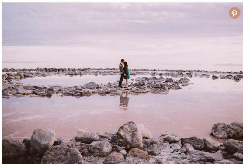
Figure 3: Photo de mariage à la Spiral Jetty.