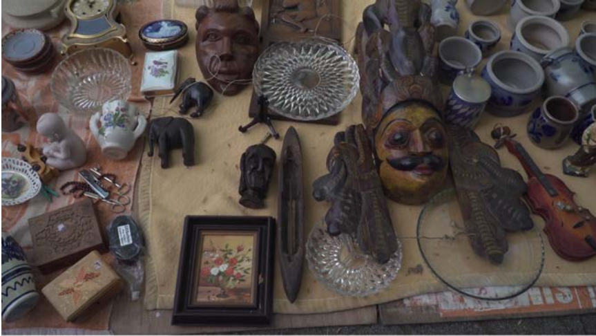
Figure 2. Navette au milieu d'un tapis d'objets (brocante du lundi de Pâques, avril 2019).

subit selon les catégories socialement construites 17 ». Selon cette approche, il s'agit non plus de considérer les objets comme des témoins d'une culture menacée de disparition, mais de souligner leur dimension polysémique ainsi que les variations d'usage et de sens qu'ils subissent au cours du temps.