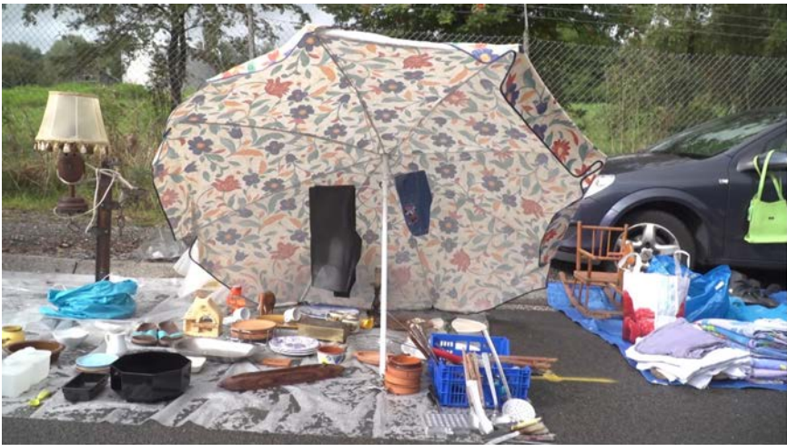
Figure 1. Etalage d'objets à la brocante de la S.P.A. (Stembert, septembre 2019).

collection de navettes de métiers à tisser pour engendrer une série de témoignages sur le passé de l'ancienne ville textile lainière de Verviers. En revenant sur les concepts d'« objet-témoin », de « biographie des choses », puis de « mémoire collective », je traiterai des rapports entre mémoire et culture matérielle en anthropologie. Dans la deuxième partie, intitulée « Penser/Classer », en hommage au recueil de textes de Georges Perec, je décrirai de manière minutieuse les opérations de tri et de rangement auxquelles je m'astreins à mon retour de brocantes. Ce passage me permettra de prendre congé des objets et des possibilités réduites d'analyse que permet la matérialité des choses pour aborder les choix de réalisation qui m'ont permis de passer de l'abondante matière des témoignages aux courtes séquences qui forment une des trames narratives du film La place des choses . Dans la dernière partie, intitulée « Représenter », je m'appuierai sur les trois séquences vidéo qui ponctuent cet article pour discuter les choix esthétiques qui ont orienté le montage. J'y argumenterai que la remise en images des témoignages sonores sur des plans tournés dans la ville donne à voir un paysage postindustriel en contrepoint des représentations habituelles de ce genre d'espace construites sur le mythe de l'âge d'or et du paradis perdu.