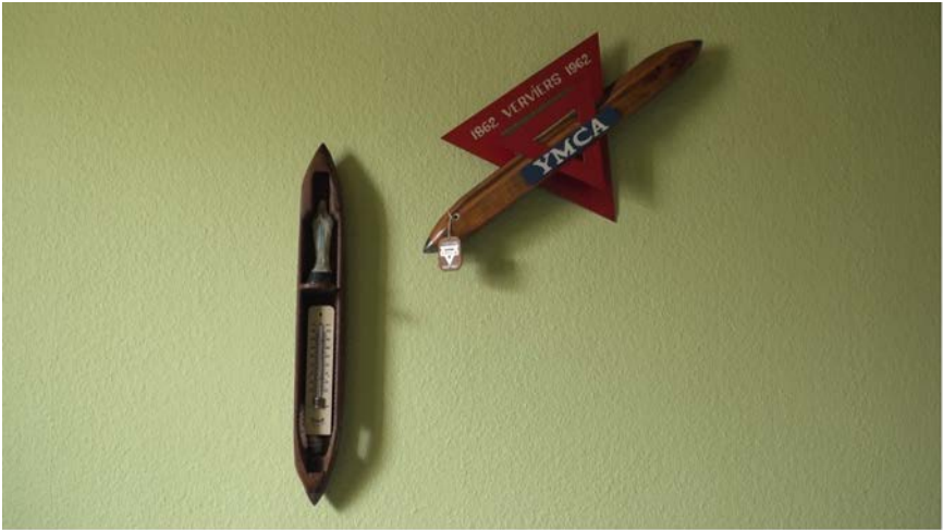
Figure 3. De retour d'une brocante (navettes n° 33 et 40).

témoignages permettent de mettre au jour. C'est l'ensemble de ces choix que je propose ici de discuter en m'appuyant sur trois séquences tirées du film La place des choses 24 .