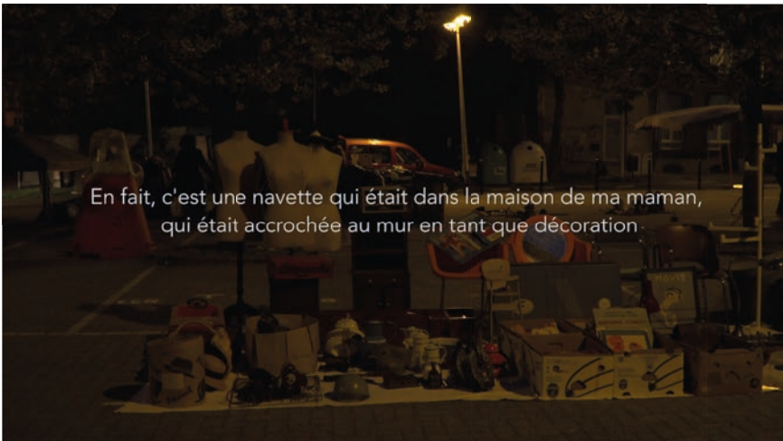
Figure 4. Photogramme de l'extrait du film La place des choses , Baptiste Aubert (à venir) : « La navette aveugle », https://erudit.org/media/im/1080951ar/1080951arv001.mp4 (consultation le 27 septembre 2021)