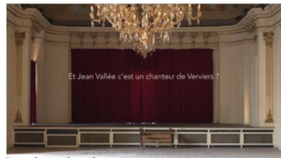
Figure 5. Photogrammes de l'extrait du film La place des choses , Baptiste Aubert (à venir) : « La navette superstar. », https://erudit.org/media/im/1080951ar/1080951arvoo02.mp4 (consultation le 27 septembre 2021)