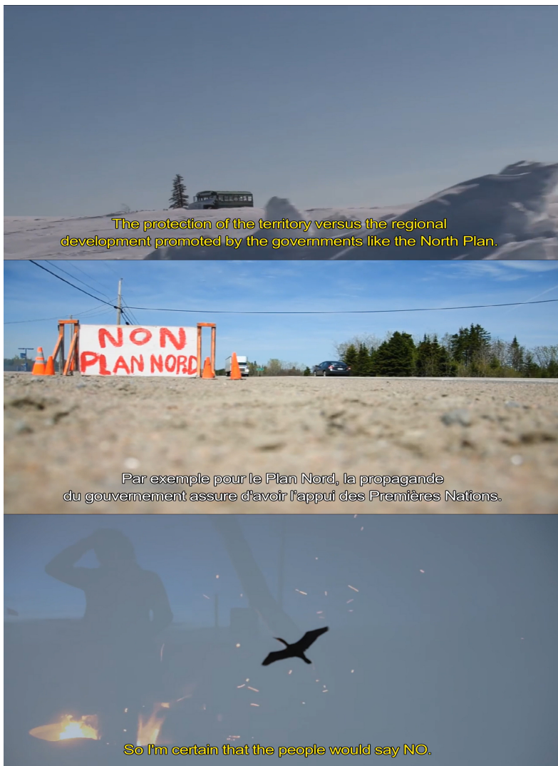
Figure 2. Photogrammes extraits de la capsule vidéo Le développement économique, notre dilemme éthique exposée dans C'est notre histoire . Une production de La Boîte Rouge VIF et des Musées de la civilisation Québec, 2013, https://www.youtube.com/watch?v=Rra4PIElsRw&feature=youtu.be&ab_channel=LaBoiteRougevif (consultation le 25 juillet 2021).