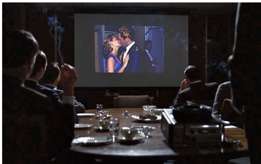
Figure 5. Photogramme de la série Mad Men , saison 1, épisode 13, «The Wheel», Matthew Weiner, 2009.

Un dernier exemple se trouve à la fin de l'épisode 13 de la saison 1 de Mad Men (Matthew Weiner, 2007–2015) 46 . Il s'agit d'un moment d'anthologie, souvent cité : Don Draper présente son idée pour la campagne entourant le lancement du projecteur à diapositives de Kodak (voir la figure 5).