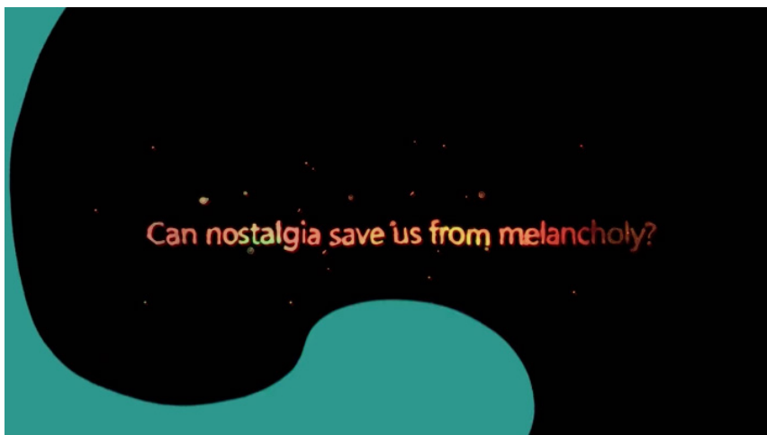
Figures 2, 3 et 4. Photogrammes de la vidéo promotionnelle pour le jeu Spleen , Pamplemousse Games, 2021.

Cette question énigmatique se trouve au milieu d'une bande-annonce promotionnelle (voir les figures 2, 3 et 4) pour un jeu vidéo RPG 2D au titre baudelairien, Spleen (Pamplemousse, 2021) 42 . Dans ce jeu de rôle vidéoludique inspiré de l'univers des mangas japonais, un avatar dépressif puise dans le monde de l'enfance la force que confèrent la fantaisie et l'espoir pour redonner un sens à sa vie glauque et monotone. En retournant en enfance (dans ses rêves, en mémoire), le personnage retrouve ce temps du possible — un temps où « tout est possible » — qui lui permet de se projeter vers l'avenir en retrouvant un présent soudain libéré de sa gangue pétrifiante. Si dans la mélancolie, le temps (ou quelque chose du temps) ne passe pas et rend le présent trop lourd à porter, la nostalgie, considérée dès lors non plus comme un état, mais comme un appel, un désir, une expérience ( nostalgiser ), permet une mise en mouvement (physique, imaginaire), dans le temps ou l'espace, animée par la jouissance de pouvoir contredire le principe de son irréversibilité. Le temps retrouvé est un temps retourné.