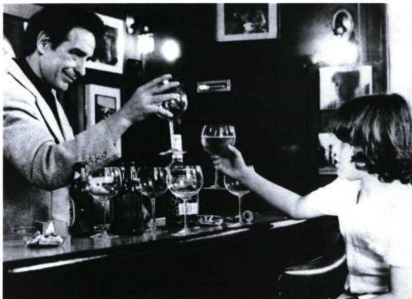
John Cassavetes comédien dans une séquence inoubliable de Love Streams alors qu'il rencontre son fils pour la première fois.

Ainsi, dès que l'histoire débute, nous ne savons rien des protagonistes, rien n'est présenté ni expliqué comme le cinéma conventionnel le fait habituellement, rien n'est situé (les décors ne sont pas décrits). Chacun, homme ou femme, se dévoile au fur et à mesure que la fiction avance, mais cette dernière n'avance pas en ligne droite, elle est titubante, disloquée, adhérant au moindre mot, au moindre regard, au moindre geste. Elle est un encéphalogramme qui enregistre les hauts et les bas, les désirs et les affects, qui mesure les différences d'intensité amoureuse, qui suit la trace d'un tremblement de terre que sont les crises, qui détecte les explosions lointaines et souterraines qui ont généré cette incroyable course pour l'existence que mène chaque personnage. C'est ainsi — aussi contradictoire que puisse paraître cette affirmation — que le cinéma de Cassavetes s'affirme comme un cinéma de l'âme.