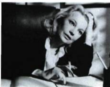
Gena Rowlands dans Love Streams

John Cassavetes a ainsi toujours pris à bras le corps le risque et le danger dans une aventure cinématographique qui n'a jamais accepté les compromis, d'où son image de franc-tireur sur le terrain de la guerre financière et de l'humanité conventionnelle d'Hollywood. C'est que chez lui vie et cinéma étaient inséparables. Intarissables comme les flux d'amour qui les emportaient. Flux qui nous l'ont dérobé trop tôt, à l'âge de 59 ans. On ne peut s'empêcher de penser à lui comme à certains de ses prédécesseurs, Nicholas Ray, Orson Welles, à la race des maudits, des meurtris et des sacrifiés d'Hollywood qui se sont offerts tout entiers au cinéma — et qui en sont morts. ●