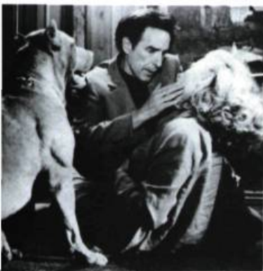
John Cassavetes comédien en compagnie de Gena Rowlands dans Love Streams

À la fin de Love Streams (1984), on voit John Cassavetes affalé dans un fauteuil derrière une vitre embuée par la pluie, image d'un homme fatigué, rongé par l'alcool, qui semble nous dire que tout est fini, terminé, en une sorte d'adieu silencieux après avoir mené à tombeau ouvert sa vie, après y avoir été entraîné dans ses flux multiples et incontrôlables. Love Streams apparaît vraiment alors comme le dernier film de Cassavetes, un film-bilan condensant toutes les autres œuvres, une visite aussi vertigineuse qu'hypersensible de tous les thèmes brassés dans ses douze productions.