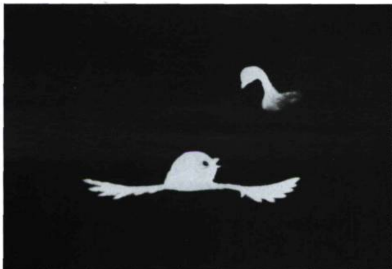
Le mariage du hibou

tion de 90 degrés. Les plans se succèdent parfois par fondus enchaînés ou fondus au noir. Un long plan noir, coupure radicale entre deux scènes, intrigue par son opacité et sa durée; le spectateur est en attente de l'image suivante (usage peu commun en animation) alors qu'une action hors-champ est signalée par des indices sonores.