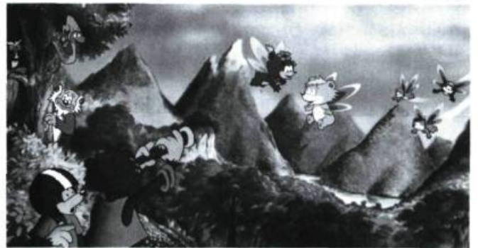
« La bande à Ovide , coproduction Québec-Belgique qui concurrence les produits japonais»

Les oursons volants est présentement en cours de réalisation chez Ciné-Groupe.