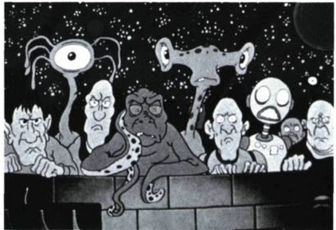
Heavy Metal de Gérald Potterton (1981) est le troisième long métrage d'animation produit au Québec.

musiciens d'ici ont une large part de création. The Smoogies a bénéficié de l'appui de Téléfilm Canada.