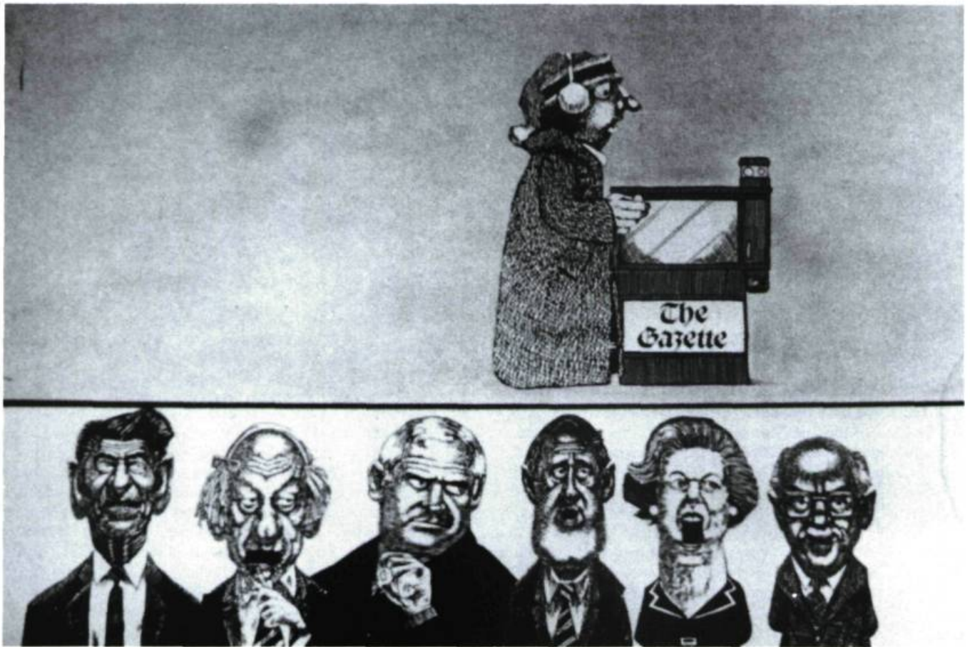
«Le film publicitaire animé est la principale activité de Michael Mills Productions, par exemple, les publicités pour The Gazette »