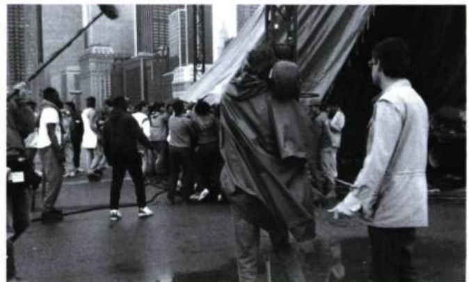
Tournage d' Un cirque en Amérique à New York.