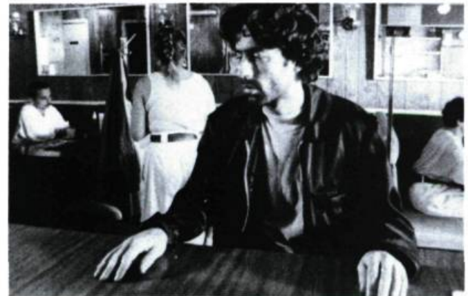
Le grand monde . La réinsertion sociale des ex-psychiatisés

Zavaglia illustre aussi le phénomène de la «désinstitutionnalisation» qui, telle qu'elle se pratique aujourd'hui, contraint le plus souvent les «bénéficiaires» à vivre dans la promiscuité des foyers d'accueil, ou en solitaire dans des maisons de chambres sordides. Dans les meilleurs cas, ceux qui n'ont pas réussi leur réinsertion dans la société peuvent se regrouper dans quelques oasis d'entraide (comme le P.A.L. 1 ) où ils peuvent exprimer leurs sentiments et ressentir un peu de chaleur humaine et de sécurité. Ces ressources alternatives apparaissent comme la seule lueur d'espoir, l'ultime bouée de sauvetage pour nombre d'entre eux.