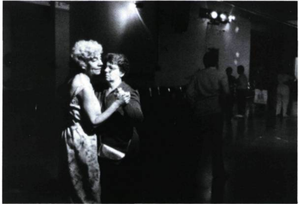
Esprit violent . «Abolir la barrière de nos préjugés envers les psychiatisés.»

Deux films axés sur les problèmes de la santé mentale, L'esprit violent de Nicola Zavaglia et Le grand monde de Marcel Simard, ont retenu récemment l'attention. Documentaire pur et fiction documentée, leur démarche et leur visée n'en sont pas moins complémentaires.