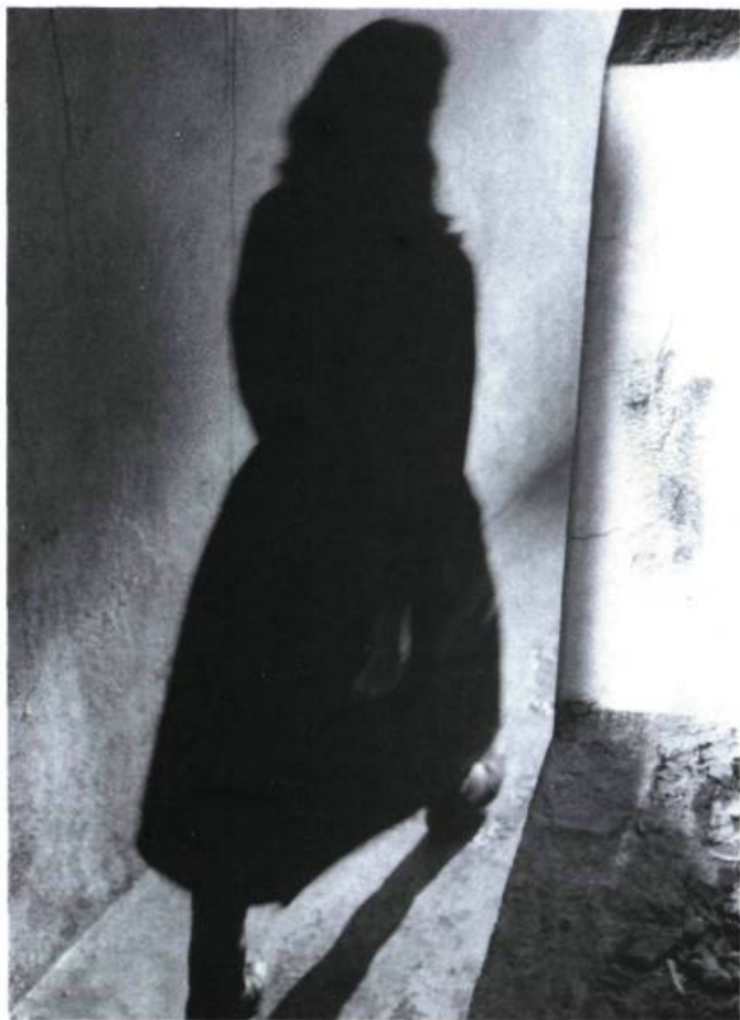
«Univers onirique» ●

Encore une fois (les exemples abondent dans le jeune cinéma québécois), c'est dans les dialogues que le film perd pied. Ils ne parviennent pas, ni dans leur contenu ni dans la façon dont ils sont dits, à soutenir l'image. Ils viennent rapidement briser la cohérence de l'univers et banaliser la relation, jusque-là fascinante, entre les deux femmes. Dans cette dérive d'images presque fugaces et parfois insaisissables, les mots prennent un poids et une matérialité qui ramènent brusquement le film à une réalité dont il était pourtant parvenu à se libérer avec grâce. ●