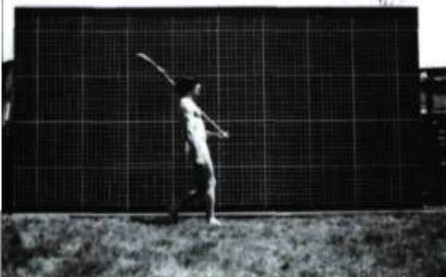
Entre tu et vous (1969)