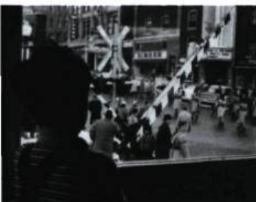
Les raquetteurs coréalisé avec Michel Brault (1958)