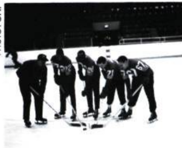
Un jeu si simple (1965)