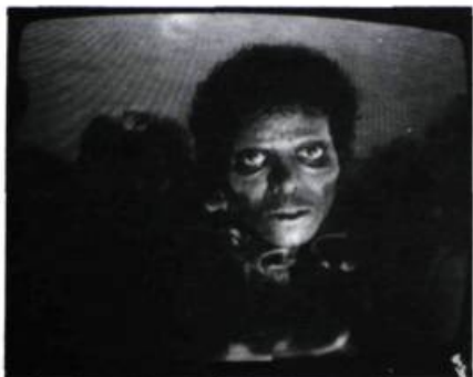
Michael Jackson dans Thriller , une réalisation de John Landis