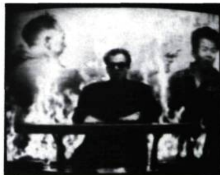
We Didn't Start the Fire de Billy Joel réalisé par Chris Blum