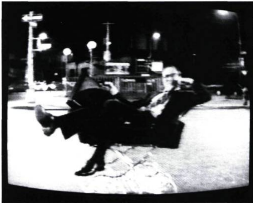
Un nouveau burlesque sous l'œil de Zbigniew Rybczynski: The Original Wrapper de Lou Reed

coïncidence qui paraîtrait autrement improbable. Enfin, dans l'insolite True Stories de David Byrne, conçu à la fois comme un faux documentaire et une grande revue, les clips jouent un double rôle de «numéro» et de commentaire ironique, en même temps qu'ils signalent le point où la banalité du spectacle quotidien se mue en spectacle de la banalité. Reste qu'à force de montrer la banalité du Texas profond, le film lui-même semble atteint d'une sorte d'aplatissement du regard.