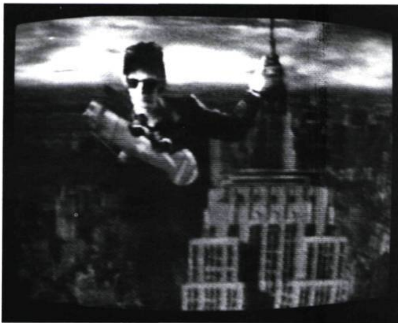
King Kong réveillé par The Cars dans You Might Think