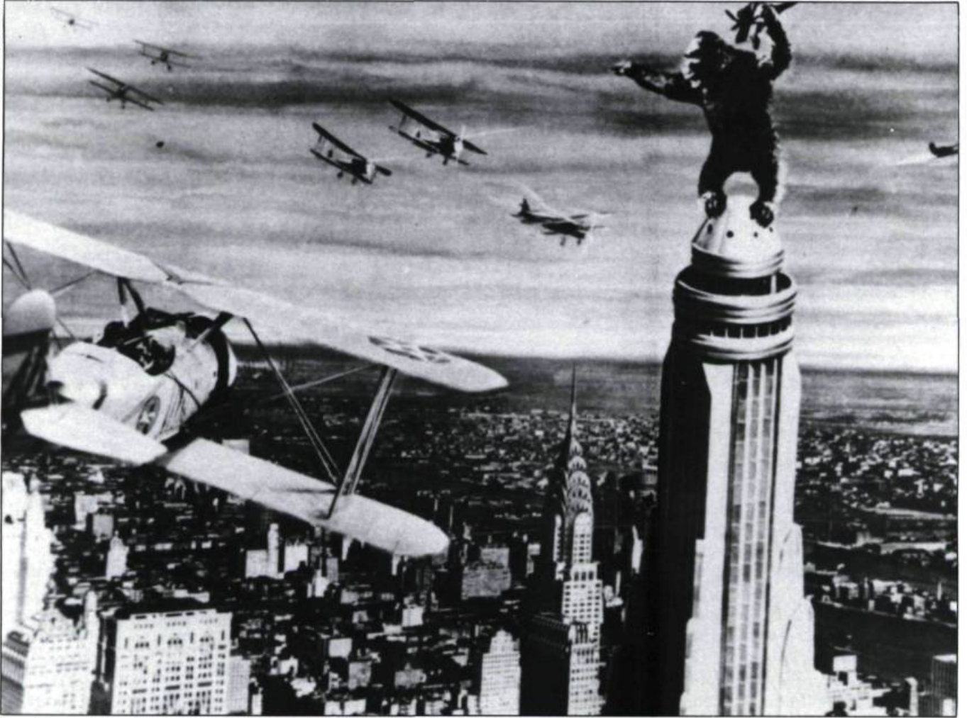
King Kong de Merian Cooper et Ernest B. Schoedsack (1933)