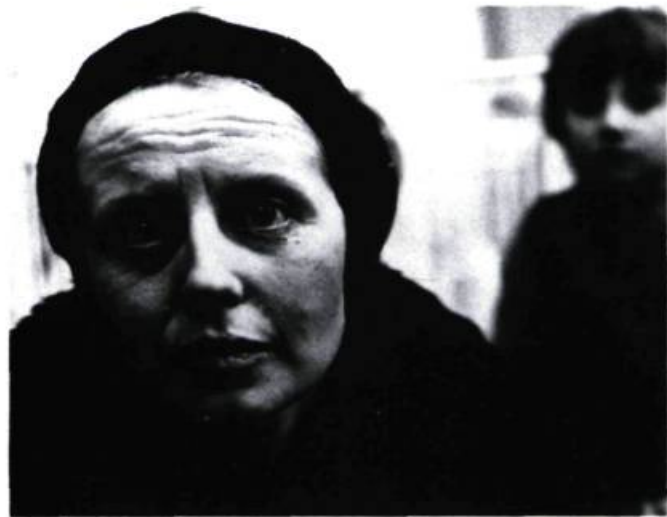
En bas : Krystyna Janda dans L'interrogatoire de Ryszard Bugajski. Prix d'interprétation féminine