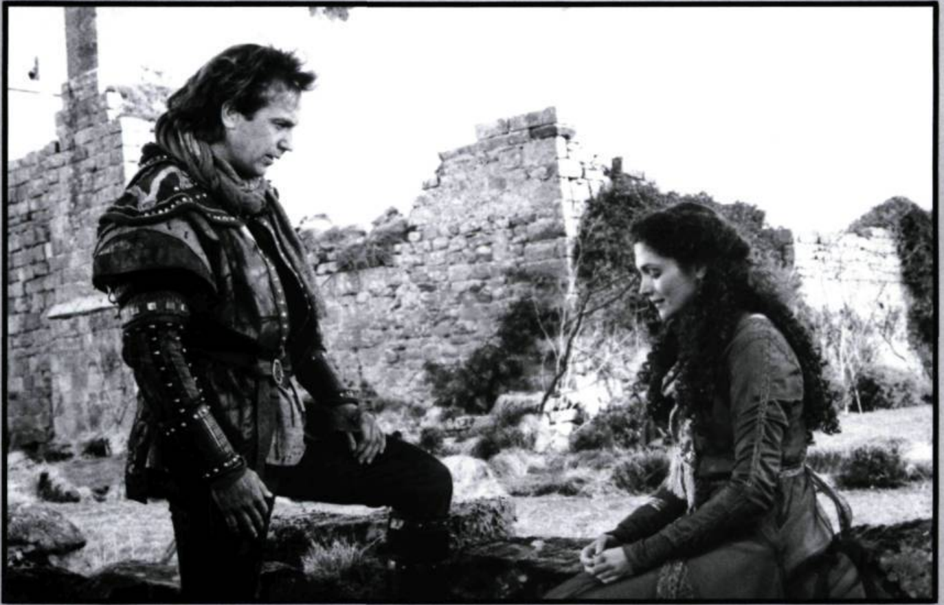
Kevin Costner — Robin Hood et Lady Marianne (Mary Elizabeth Mastrantonio)

que tu crois» sont exaltées. La filiation avec les histoires de Job et Noé (le terrain de baseball vu comme une arche pour les joueurs en disgrâce) fournit le terreau mythique nécessaire à l'accession du personnage au statut de héros. De plus, le film marque une certaine cassure dans la forme du discours patriotique jusqu'ici à l'honneur dans le cinéma des années Reagan en l'orientant vers un humanisme nettement plus rooseveltien, axé sur la tolérance, la liberté d'expression et la possibilité d'accomplir des actes apparemment dénués de sens pratique ou de débouchés carriéristes et lucratifs. Je dis bien apparemment, puisqu'il s'agit de vendre la même chose avec un autre slogan.