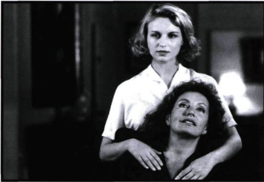
Anna (Fabienne Babe) et sa mère (Louise Marleau). Deux perceptions antagoniques du monde.

de ne pas penser en voyant Le mirage . Les similitudes se situent cependant moins au niveau formel qu'au niveau de ce qui anime profondément les personnages: ce désir d'accomplir sa destinée envers et contre tous en rejetant toutes les contingences extérieures, cette «recherche de l'absolu» qui inexorablement entraîne vers la mort. Madame Tümmler se lance dans une quête passionnelle qui vient l'arracher à la succession monotone des jours mais surtout à la vieillesse qu'elle anticipe avec une crainte mêlée de résistance.