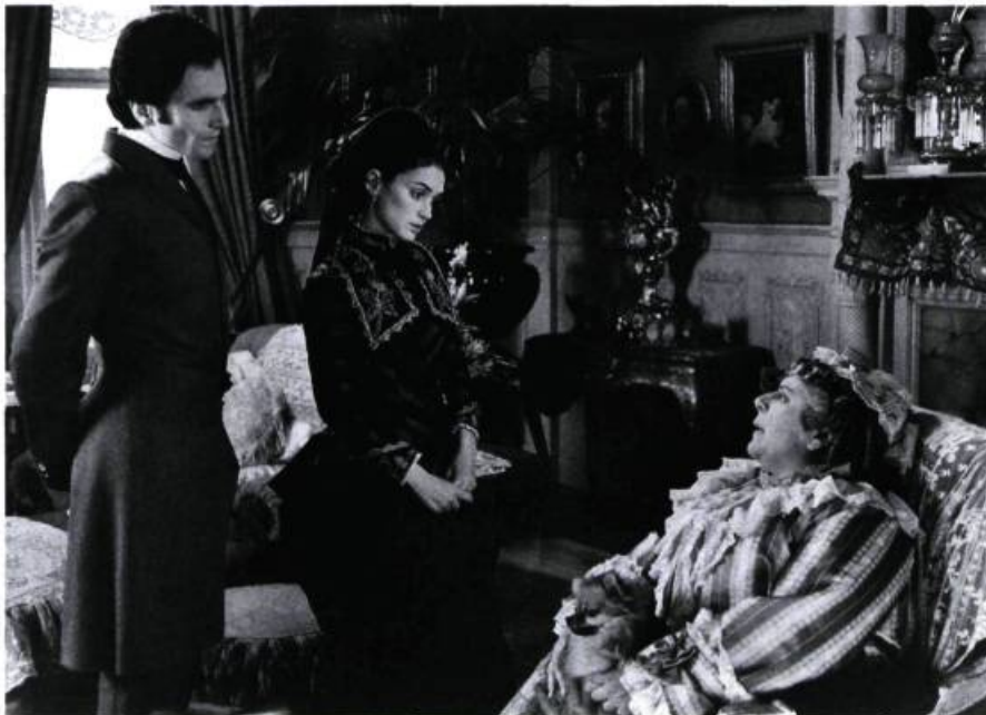
Newland Archer (Daniel Day-Lewis), May Welland (Winona Ryder) et Mrs. Mingott (Miriam Margolyes).